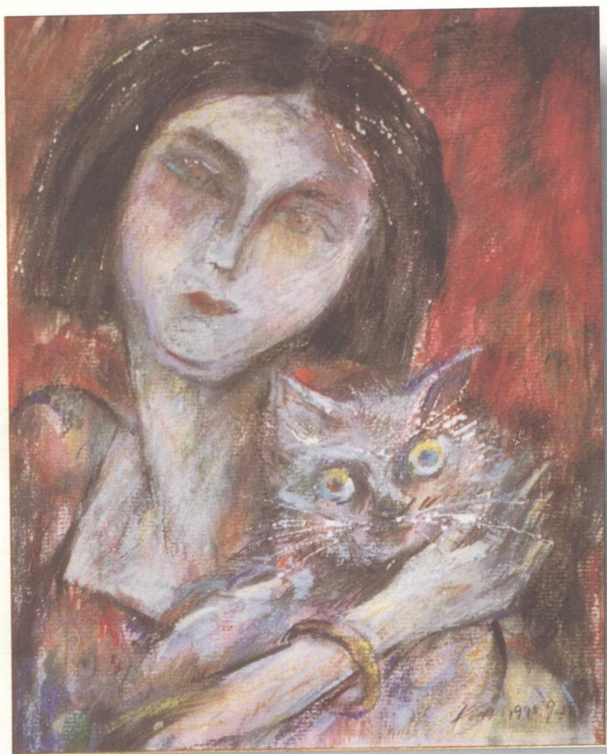
为从容造像 孔森 / 1995 作