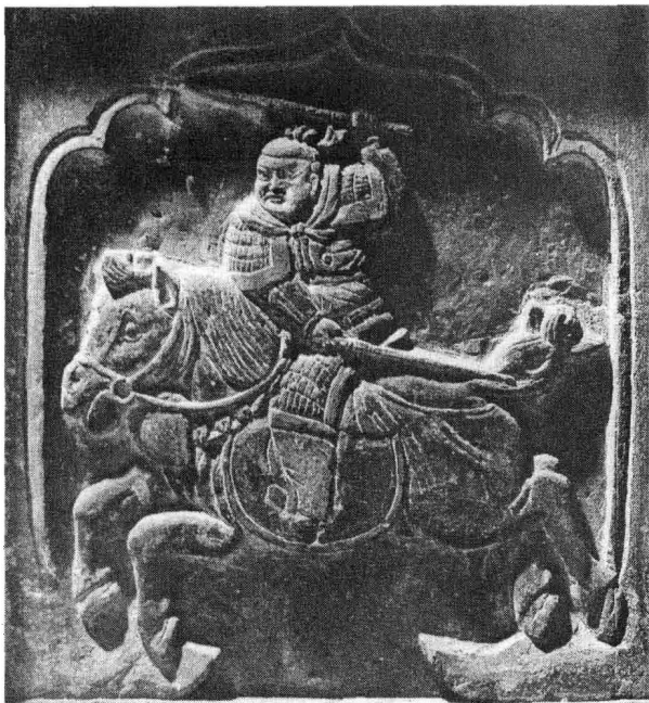
山西出土《女真骑马武士雕刻》像。

当渤海强盛时，部分黑水靺鞨人为其役属；及其衰弱时，摆脱其统治，于后唐庄宗同光二年(924)，复与中原王朝建立联系。渤海亡后，辽统治者南迁渤海遗民，黑水靺鞨亦随向南伸张，并代渤海而兴。契丹人称黑水靺鞨为“女直(真)”，此后，女真这一称呼逐渐代替了靺鞨。