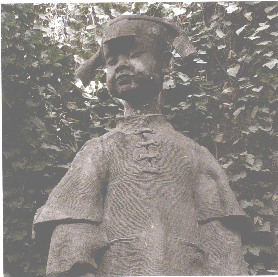
《淘海人家》之二（局部） 材质：陶艺