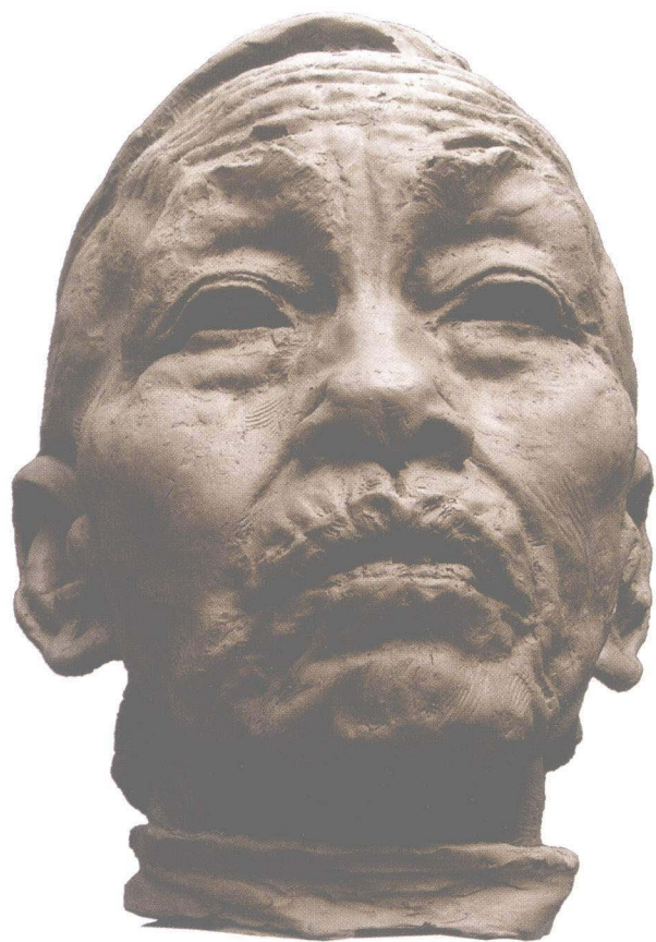
《淘海人家》之一（局部） 材质：泥塑