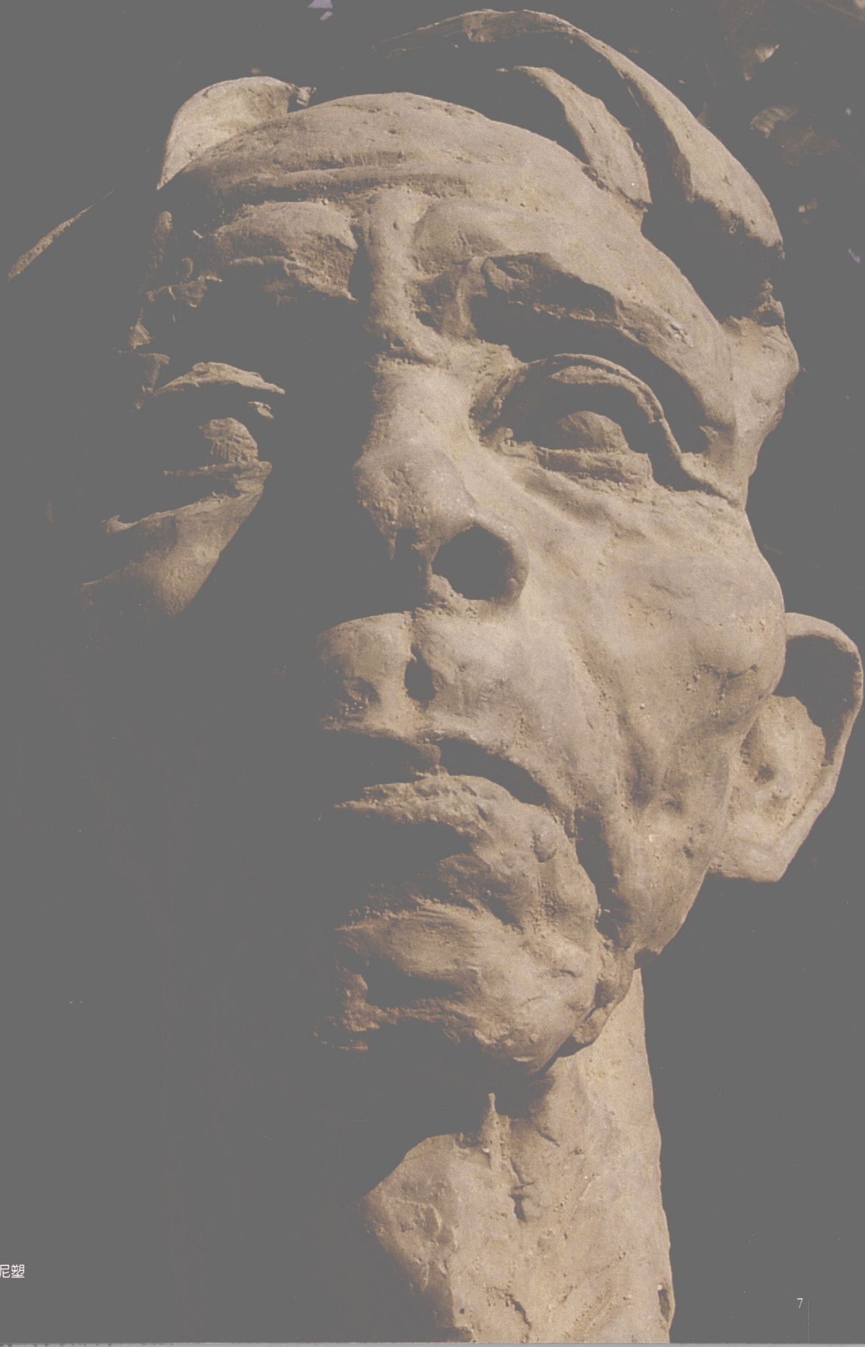
《林场老人——阿发》材质：泥塑