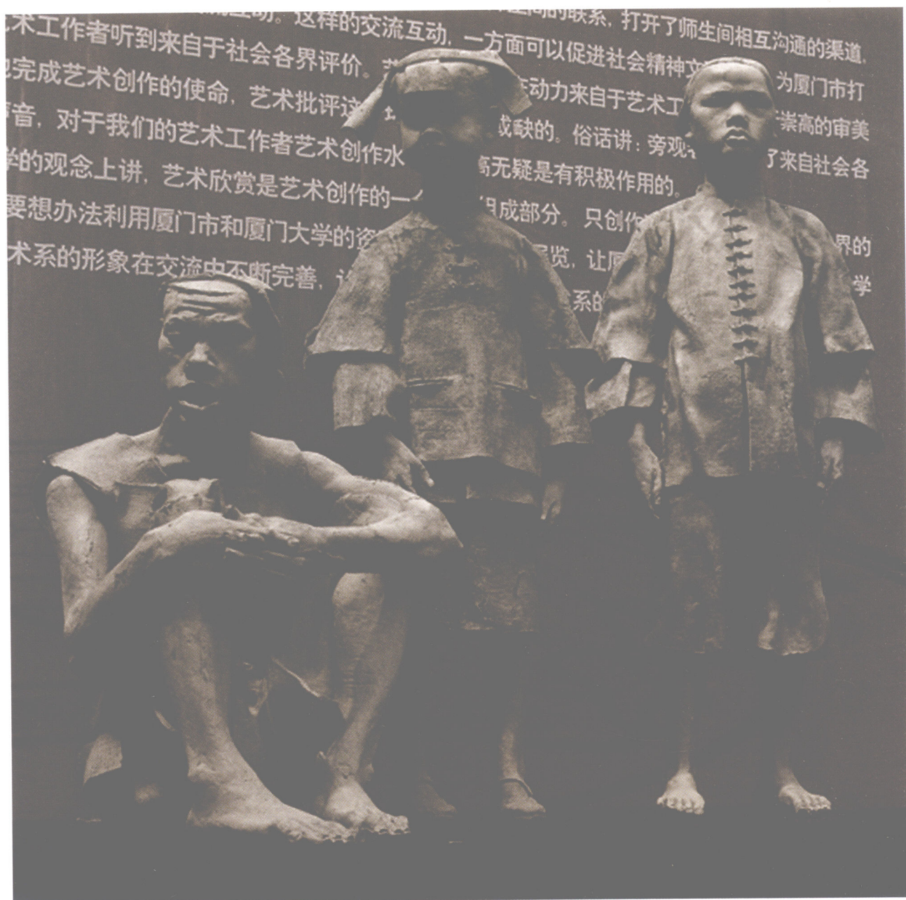
《淘海人家》之二 材质：陶艺