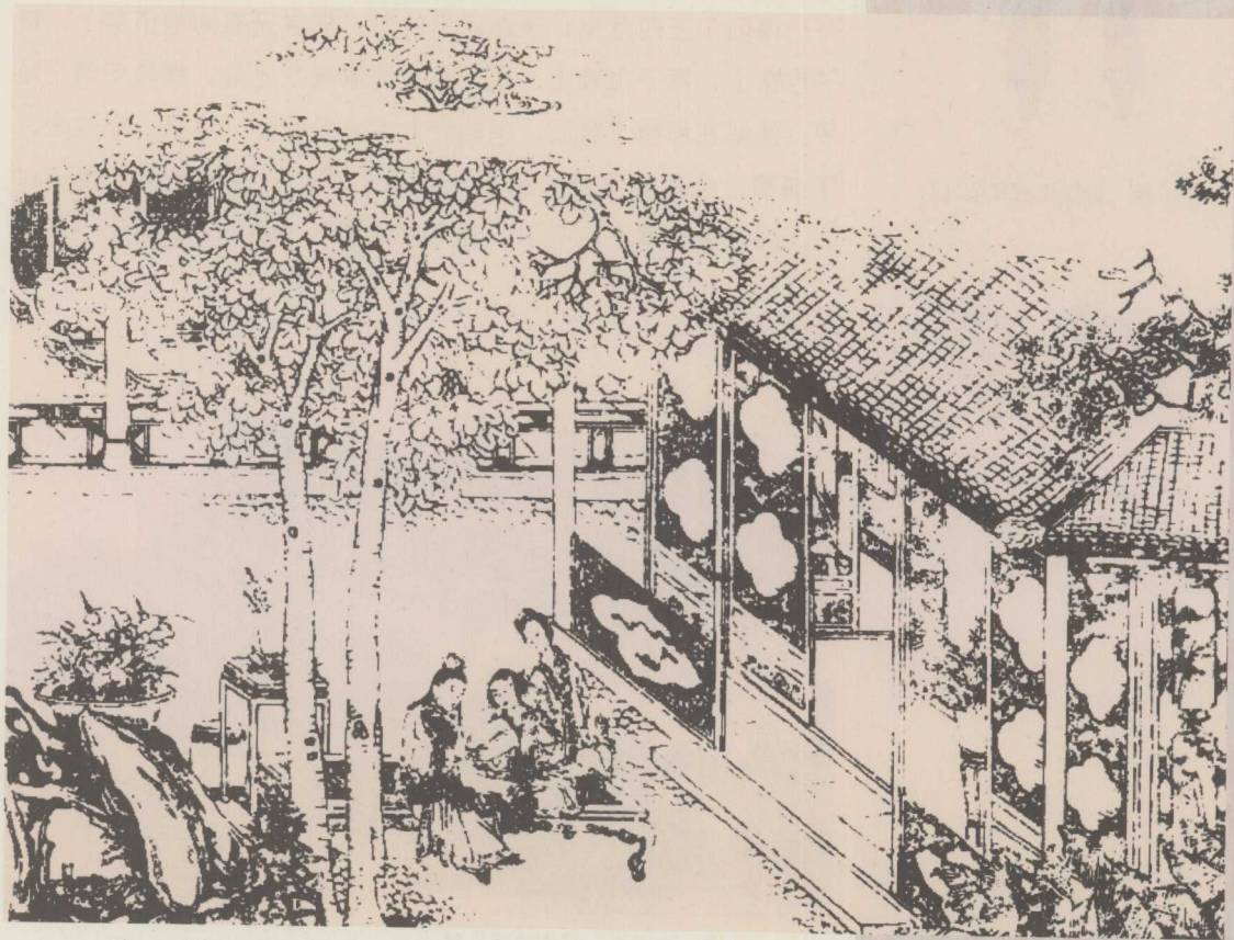
清·王钊画：撕扇子作千金一笑

出气。就如杯盘，原是盛东西的，你喜欢听那声响，就故意的碎了，也可以使得，只是别在生气时拿他出气。这就是爱物了。”晴雯听了，笑道：“既这么说，你就拿了扇子来我撕。我最喜欢撕的。”宝玉听了，便笑着递与他。晴雯果然接过来，嗤的一声撕了两半，接着嗤嗤又听几声。宝玉在旁笑着说：“响的好，再撕响些！”正说着，只见麝月走过来，笑道：“少作些孽罢！”宝玉赶上来，一把将他手里的扇子也夺了，递与晴雯。晴雯接了，也撕了几半子。二人都大笑。麝月道：“这是怎么说？拿我的东西开心儿。”宝玉笑道：“打开扇子匣子，你拣去。什么好东西。”麝月道：“既这么说，就把匣子搬了出来，让他尽力的撕，岂不好？”宝玉笑道：“你就搬去。”麝月道：“我可不造这孽。他也没折 22 了手，叫他自己搬去。”晴雯笑着，倚在床