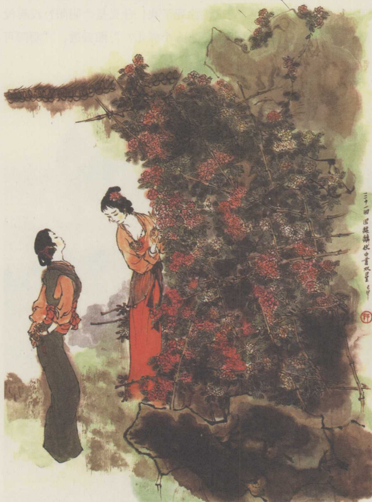
戴敦邦画：因麒麟伏白首双星

时，便往怡红院来找袭人。因回头说道：“你们不必跟着，只管瞧你们的朋友亲戚去，留下翠缕服侍就是了。”众人听了，自去寻姑觅嫂，早剩下湘云翠缕两个人。翠缕道：“这荷花怎么还不开？”史湘云道：“时候没到。”翠缕道：“这也和咱们家池子里的一样，也是楼子花 29 。”湘云道：“他们这个，还不如咱们的。”翠缕道：“他们那边有棵石榴，接连四五枝，真是楼子上起楼子。这也难为他长。”湘云道：“花草也是同人一样，气脉充足，长的就好。”翠缕把脸一扭，说道：“我不信这话。若说