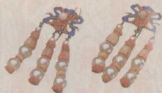
[图] 金镶珠翠耳坠 (3)

上，说道：“我也乏了，明儿再撕罢。”宝玉笑道：“古人云：千金难买一笑。几把扇子，能值几何。”一面说着，一面叫袭人。袭人才换了衣服走出来。小丫头佳蕙过来拾去破扇，大家乘凉，不消细说。