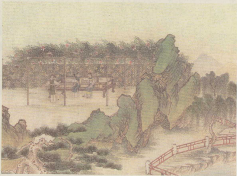
清·孙温画：晴雯撕扇作戏

至次日午间，王夫人、薛宝钗林黛玉众姊妹正在贾母房内坐着，就有人回：“史大姑娘来了。”一时，果见史湘云带领众多丫鬟媳妇走进院来。宝钗黛玉等忙迎至阶下相见。青年姊妹间经月不见，一旦相逢，其亲密自不消说得。一时，进入房中，请安问好，都见过了。贾母因说：“天热，把外头的衣服脱了罢。”史湘云忙起身宽衣。王夫人因笑道：“也没见穿上这些作什么？”史湘云笑道：“都是二婶婶叫穿的，谁愿意穿这些。”宝钗一旁笑道：“姨娘不知道他穿衣裳还更爱穿别人的衣裳。可记得旧年三四月里，他在这里住着，把宝兄弟的袍子穿上，靴子也穿上，额子也勒上，猛一瞧，倒像是宝兄弟，就是多两个坠子。他站在那椅子背后，哄的老太太只是叫：‘宝玉，你过来，仔细那上头挂的灯穗子招下灰来迷了眼。’他只是笑，也不过去。后来大家掌不住笑了，老太太才笑了，说：‘倒扮上小子好