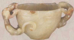
碗 (1—2) [图] 玛瑙碗 (1)

们’来了。明公正道，连个姑娘 12 还没挣上去呢，也不过和我似的，那里就称上‘我们’了。”袭人羞的脸紫涨起来，想一想原是自己把话说错了。宝玉一面说：“你们气不忿，我明儿偏抬举他。”袭人忙拉了宝玉的手：“他一个糊涂人，你和他分证什么！况且你素日又是有担待 13 的，比这大的过去了多少，今儿是怎么了！”晴雯冷