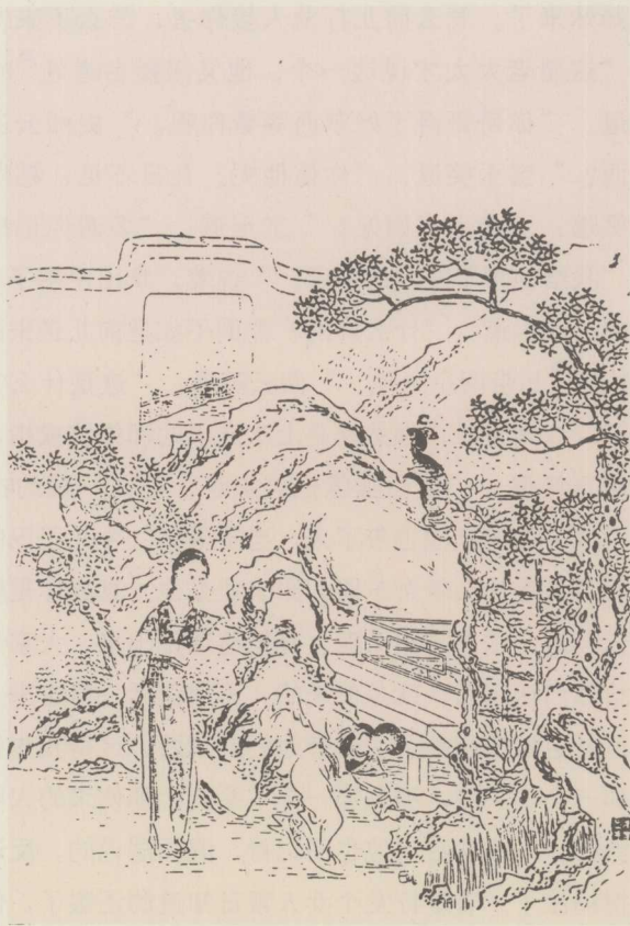
清·金玉缘图像：因麒麟伏白首双星

“这算什么。惟有前年正月里接了他来，住了没两日，下起雪来，老太太和舅母那日想是才拜了影 23 回来，老太太的一个簇新的大红猩猩毡斗篷 24 放在那里。谁知眼错不见，他就披了，又大又