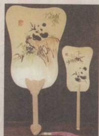
[图] 玉版扇 (2)