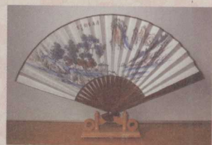
[图] 折扇 (3)