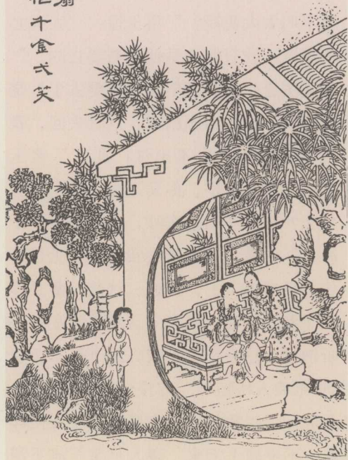
清·增评补图石头记：晴雯撕扇

笑道：“我原是糊涂人，那里配和你说话呢！”袭人听说道：“姑娘到底是和我拌嘴呢，是和二爷拌嘴呢？要是心里恼我，你只和我说，不犯着当着二爷吵；要是恼二爷，不该这么吵的万人知道。我才也不过是为了事，进来劝开了，大家保重。姑娘倒寻上我的晦气 14 。又不像是恼我，又不像是恼二爷，夹枪带棒 15 ，终久是个什么主意？我就不多说，让你说去。”说着，便往外走。宝玉向晴雯道：“你也不用生气，我也猜着你的心事了。我回太太去，你也大了，打发你出去，好不好？”晴雯听见了这话，不觉又伤起心来，含泪说道：“我为什么出去？要嫌我，变着法儿打发我出去，也不能够。”宝玉道：“我何曾经过这个吵闹。一定是你要出去了，不如回太太打发你去罢。”说着，站起来就要走。袭人忙回身拦住，笑道：“往那里去？”宝玉道：“回太太去。”袭人笑道：“好没意思。真个的去回，你也不怕臊了他。便是他认真要去，也等把这气下