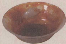
[图] 玛瑙金鱼纹碗 (2)