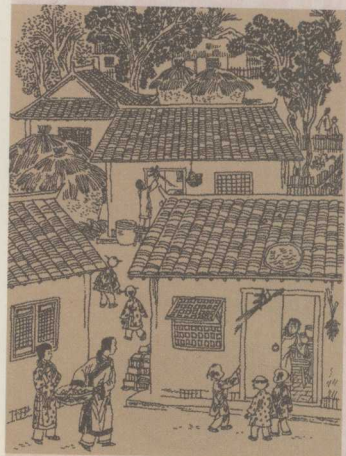
端午节，人们在门上插挂菖蒲和艾草以辟邪