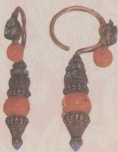
[图] 清 银嵌松石耳坠 (2)