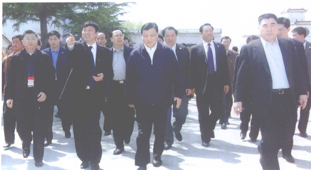
2007年4月8日，中共中央政治局委员、中共中央书记处书记、中宣部部长刘云山在河南省委书记徐光春，原省委副书记、省长李成玉等省市领导的陪同下，到宝丰调研文化产业