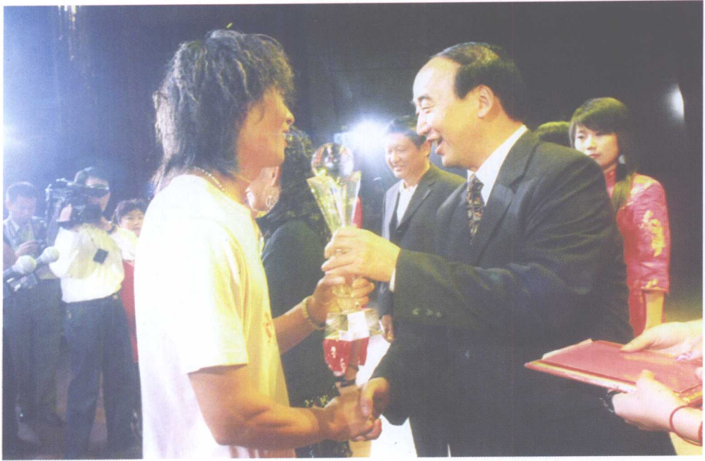
原中共平顶山市委书记邓永俭在“中国·宝丰第三届魔术文化节”颁奖晚会上为宝丰获奖演员颁奖