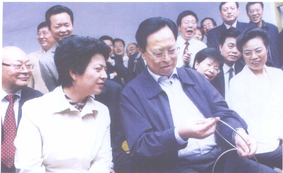
2006年10月20日，中共河南省委书记徐光春亲临宝丰县赵庄乡周营村，调研宝丰文化产业发展情况，图为徐光春书记和孔玉芳部长在农民魔术师家中