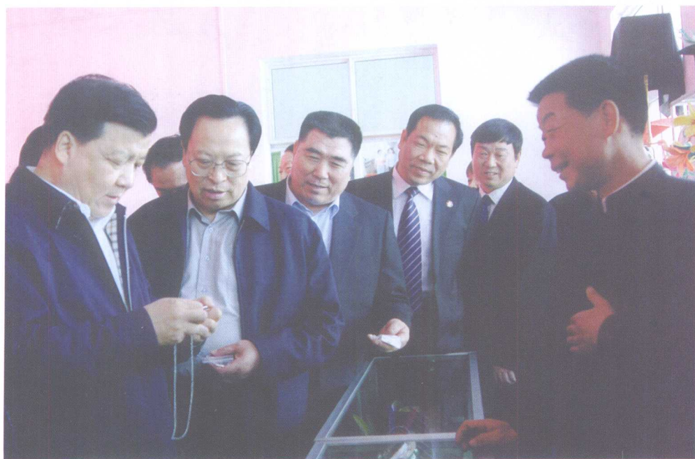
2007年4月8日，刘云山部长在宝丰四通瞬发魔术培训基地视察