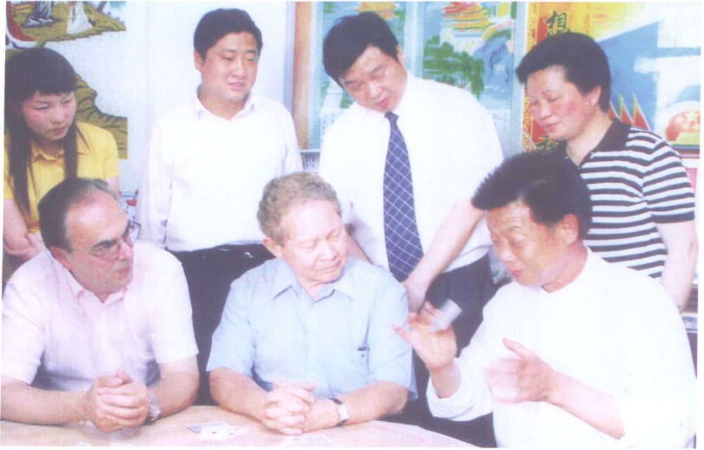
农民魔术师与国际大师在一起交流技艺