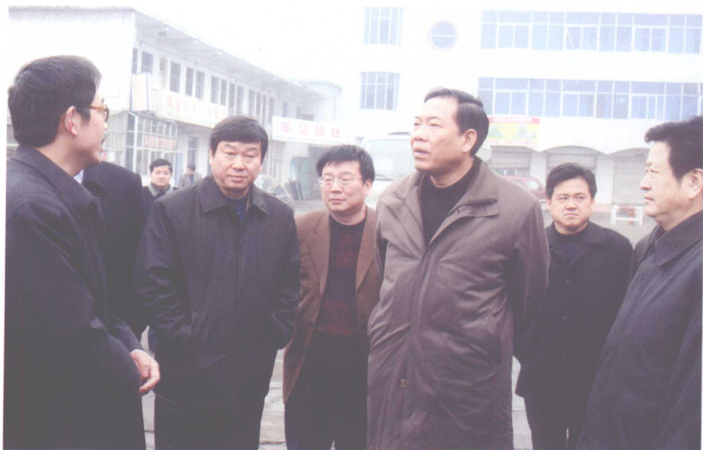
中共平顶山市委书记赵顷霖（右三）在宝丰调研文化产业发展情况