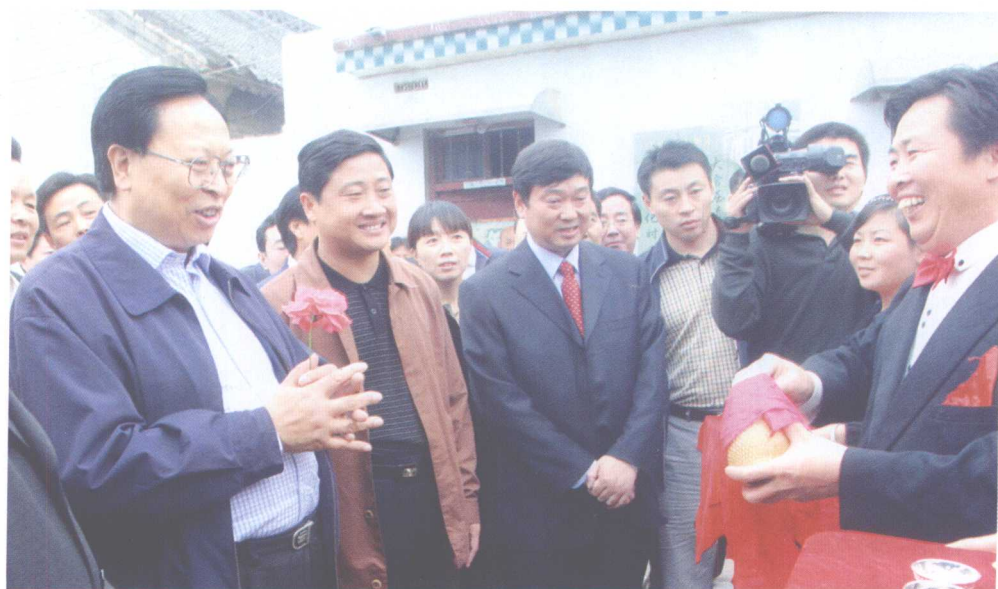
2006年10月20日，徐光春书记来到周营村观看农民魔术师靳全亮的表演