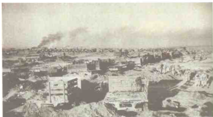
1948年12月，人民解放军在双堆集全歼国民党军黄维兵团