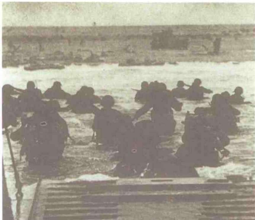
1944年6月6日，盟军在诺曼底登陆，开辟欧洲第二战场