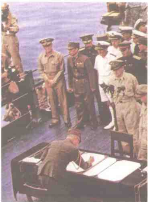
1945年9月2日，日本代表在东京湾美舰“密苏里”号上签字投降。