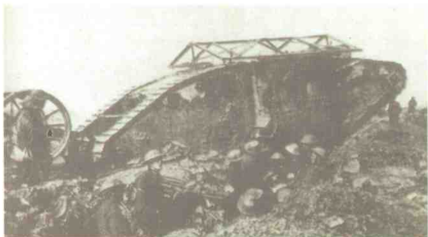
英军在1916年索姆河会战中首次使用坦克