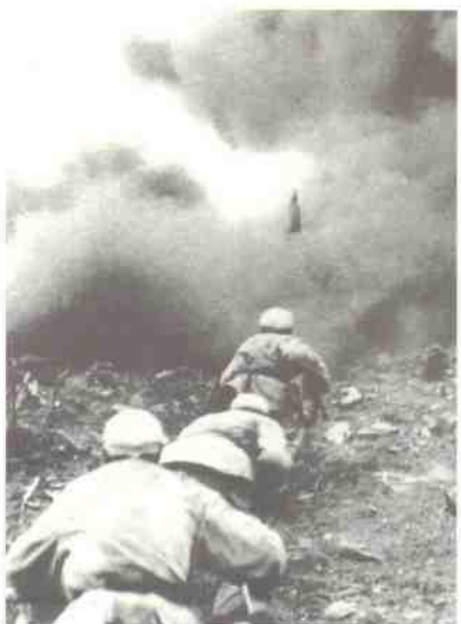
1952年秋，中国人民志愿军在上甘岭战斗中。