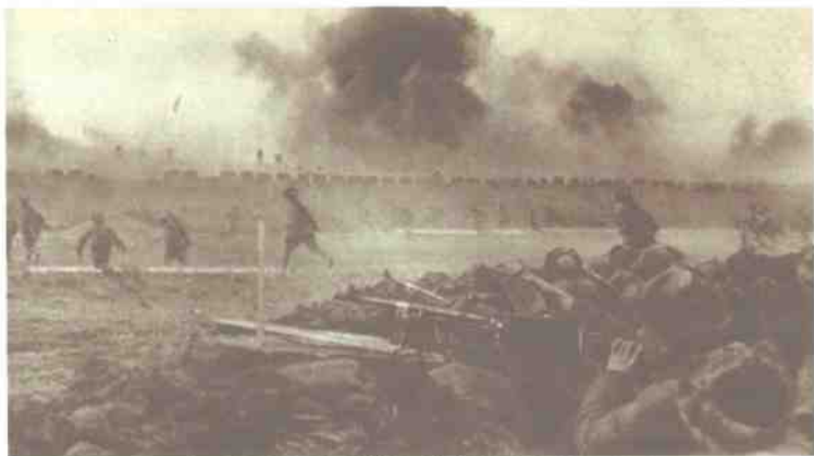
人民解放军向锦州国民党军队发起总攻