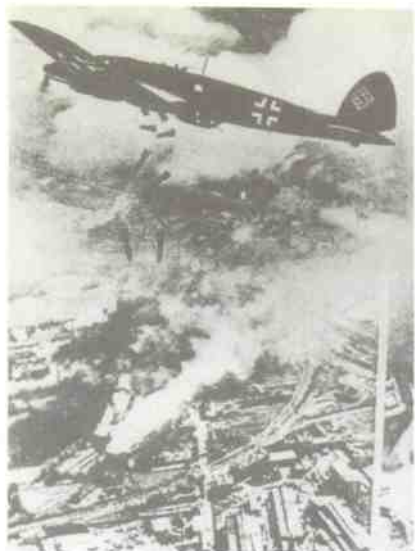
1939年9月1日，德军攻击波兰，轰炸华沙。