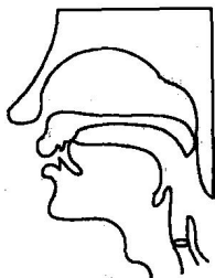
2 翘舌音 zh、ch、sh