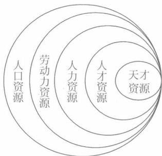
图 1-2 人口资源、劳动力资源、人力资源、人才资源和天才资源包含关系图

应当说,这五个概念关注的重点不同,人口资源、劳动力资源更多的是一种数量概念,人力资源、人才资源、天才资源更多的是一种质量概念。五者在数量上存在着一种包含关系,(图 1-2,图 1-3 所示为五者之间的比例关系图)。