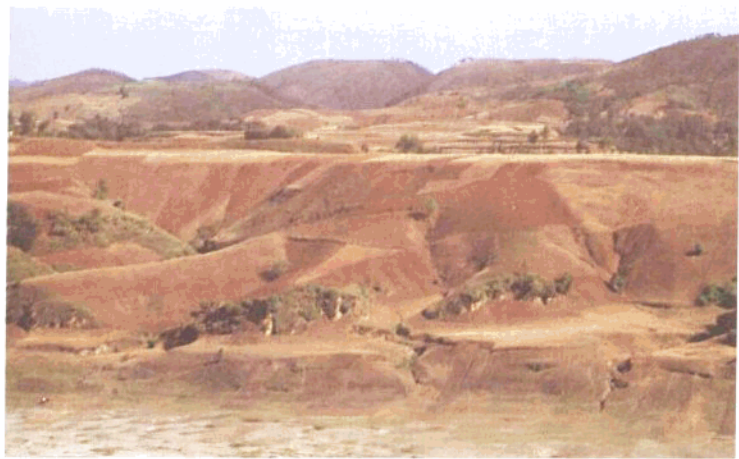
鸡公山旧石器时代遗址鸟瞰