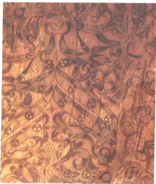
蟠龙飞凤纹绣浅黄绢面衾