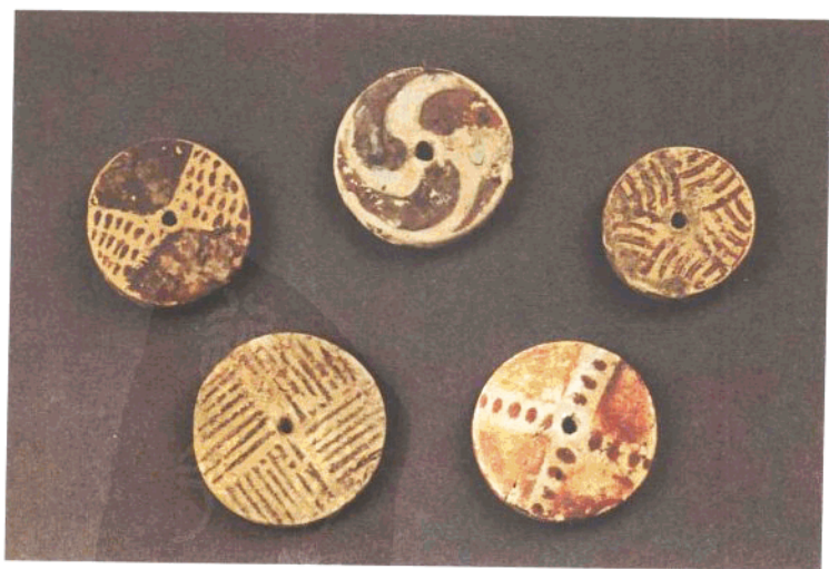
屈家岭文化遗址出土的彩陶纺轮