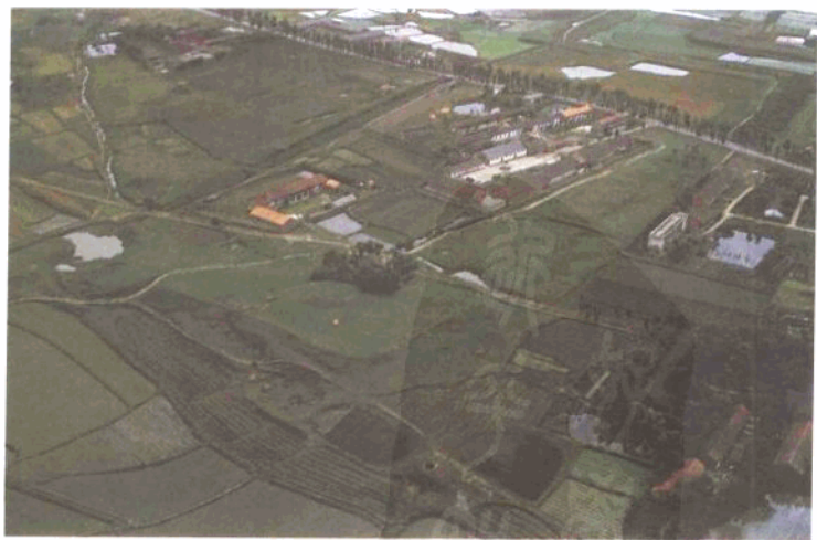
楚故都纪南城东南角鸟瞰