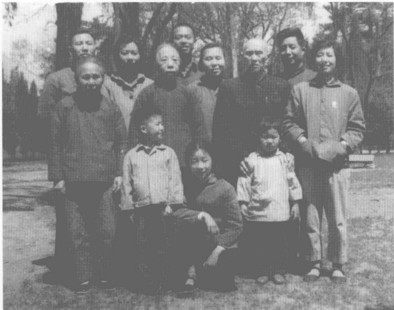
與家人合影（二十世紀七十年代初）