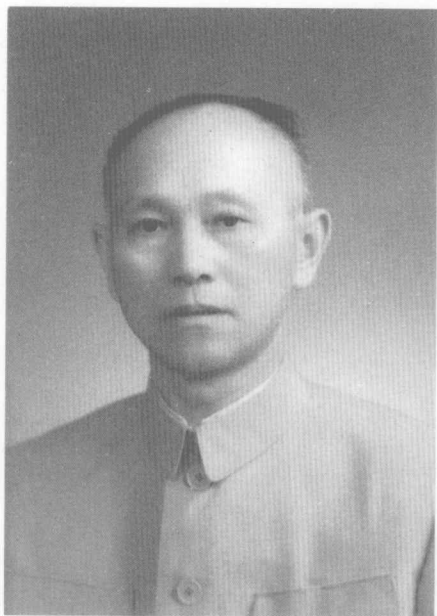
在青島編《中國文學史》時 留影（1957年7月）