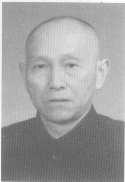
攝于訪問日本前（1963年）