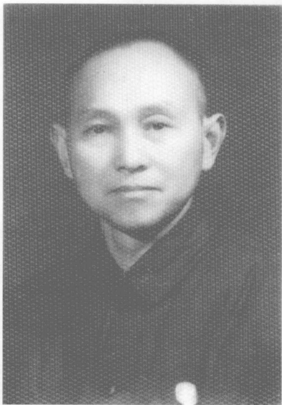
攝于二十世紀五十年代初