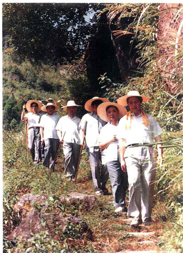
地、县领导在 寿宁县山村。