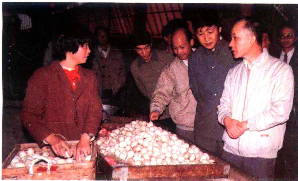
陪同省委书记陈光毅视察屏南县。