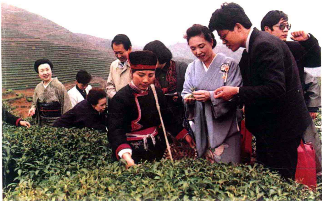
日中文化友好茶道团参观福安坦洋村茶园。