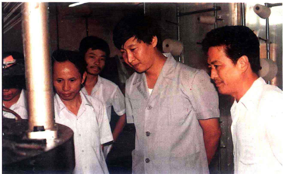
在霞浦县调查工业。