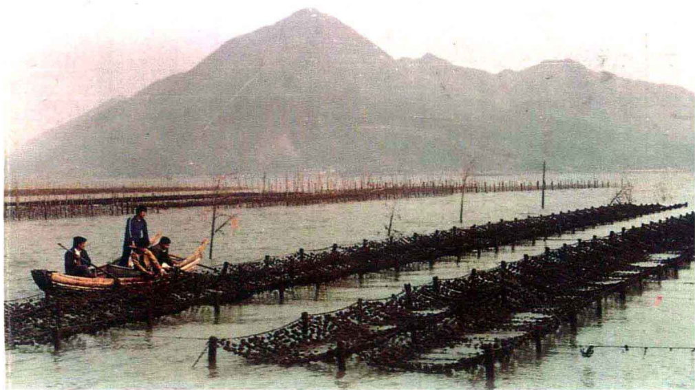
宁德漳湾拱屿村挂养牡蛎获得成功。