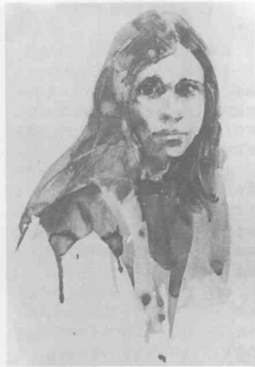
穿棕色毛线衫的人: 8×10吋 我想要使画面简练而不杂乱,所以尽量把许多深颜色合并起来,请注意头发是怎样和脸侧的阴影融化在一起的。我想突出眼神,所以在这里我用笔较为明确肯定。

正如我前面提到,我在用具箱里带着全部画具,它用坚固的塑料制成的然而却十分轻巧。这些箱子有好几种规格,我的大约是14×6×8吋,是在本地一家处理商店买到的,我带着它真吃不消。我想如果能带一个小些的更好。但是,这一个有装放所有东西的优点,包括水壶和一盒薄纱,象调色盘那样。它还有可以装铅笔、刀片和管筒颜料的格子。我的调色盘是可以折叠的带有管槽的金属调色盒,但是这种管槽不是用来存放透明水彩的管色的,所以,我把它搁在一边。不要买带有干色块的调色盒或者是便宜的塑料调色盘,它既不耐用也不好使。我在画室里用的调色盘和户外速写用的一样。另一种可在画室里用的调色盘是琼琅的外科医生用的浅盘子,它宜于大量调色。如果你常在画室里作画,这是最理想的调色盘。