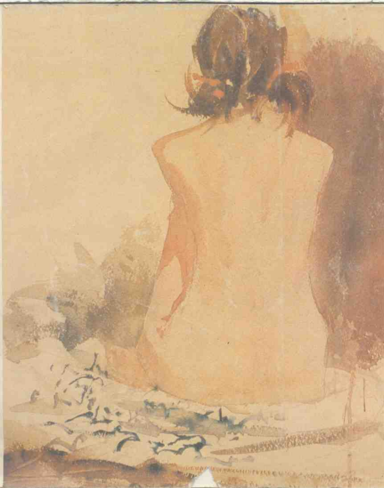
FIGURE PAINTING IN WATERCOLOR