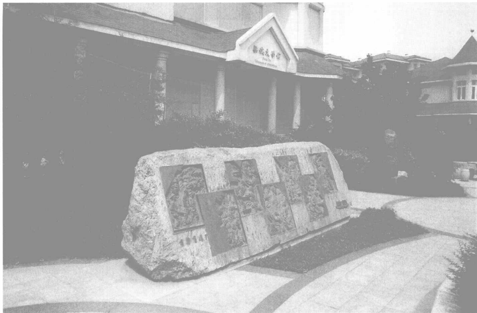
坐落在天津市区的“梁斌文学馆”