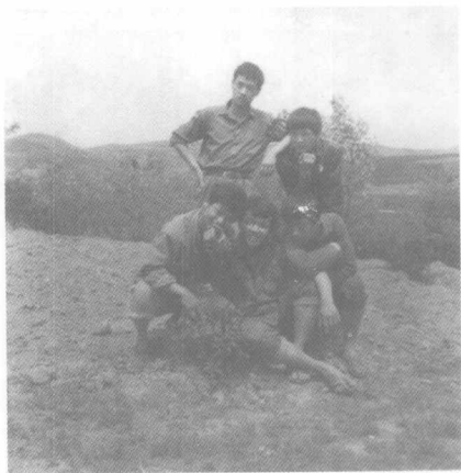
山间地头