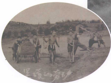
紧张的劳动