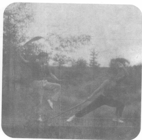
舞刀弄棍