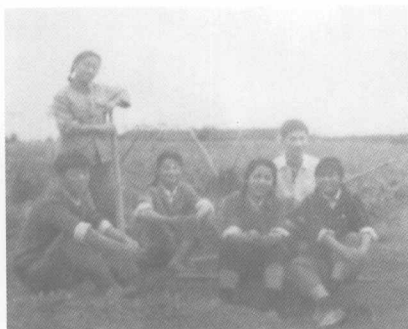
田边小憩 1975