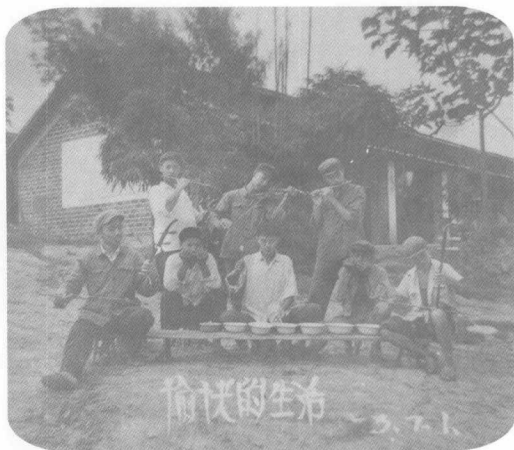
愉快的生活 1973