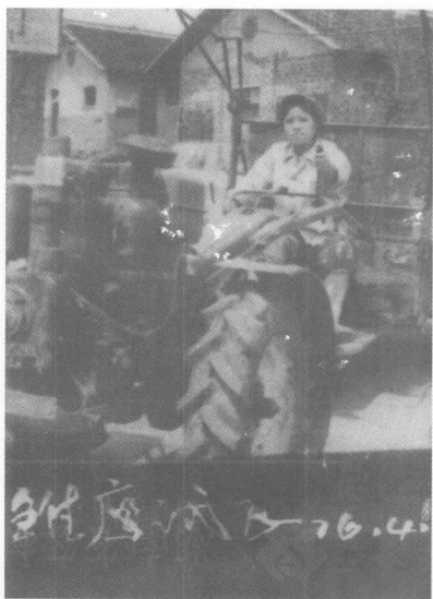
女拖拉机手 1976