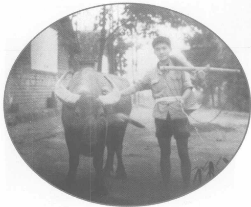
人勤春早