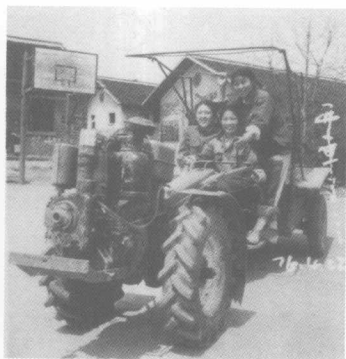
学开拖拉机 1976