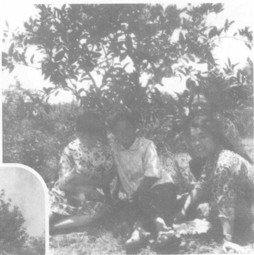
果园休闲