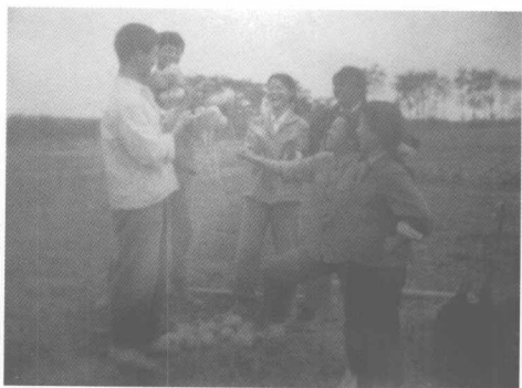
品尝劳动果实 (任强提供)