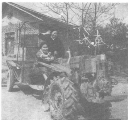
试车 1976