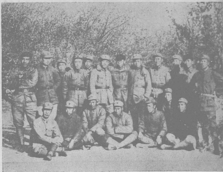
長征中的各位將領