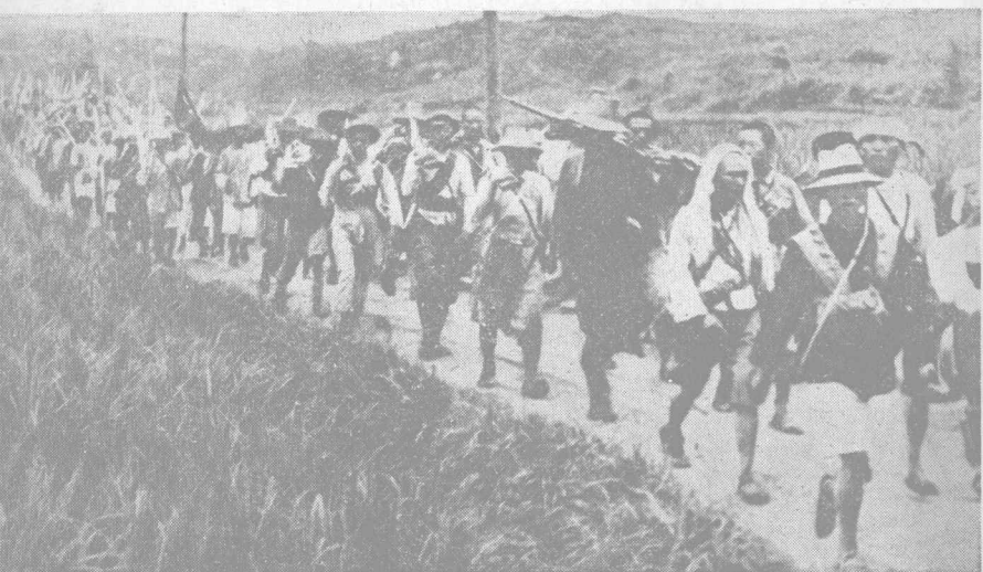
長征中的工農紅軍