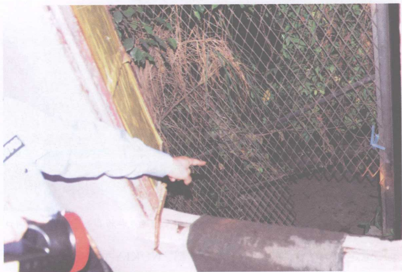
走私分子在隔离铁丝网中挖的洞

箱一个个从保税区内的货车上搬到区外的接货车辆中，搬运完毕再用爬山虎等将其遮盖住，然后迅速离开，一般人无法察觉。