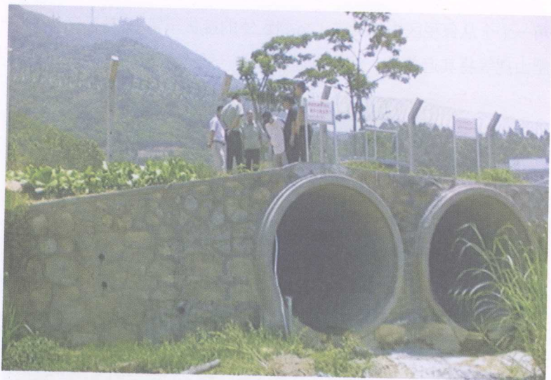
用于偷运走私物品进境的排洪涵洞口

获涉嫌走私的全新NOKIA手机300部、NOKIA手机电池300块及手机液晶显示屏900个。与此同时，香港海关缉私人员则在打鼓岭莲麻坑路地段采取行动，当场抓获3名负责运送手机的涉案人员，缴获540部手机、3970部手机液晶显示屏及白银锭33块（重495公斤），并在通往排洪渠道的沿路缴获手机650部及880个手机液晶显示屏。