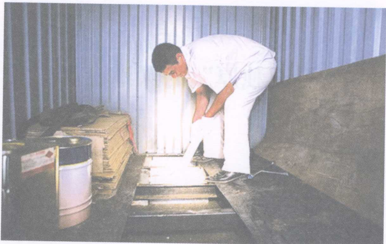
藏匿在货柜车车厢地板暗格内的白银

货车进行监控,发现这几辆粤港货车几乎每天都在皇岗或文锦渡口岸空进空出,当货车入境后,便开进深圳南山区科技园一无名汽修厂。经查发现,汽修厂的铁皮棚内挖有一道修车凹槽,涉嫌走私白银的粤港货车进入修车厂后倒车进入铁皮棚,汽修人员利用专用拆卸工具从涉嫌货车的尾部大梁暗格内拆出块状银砖并搬至旁边停放的小车内,随后,将白银快速运走。