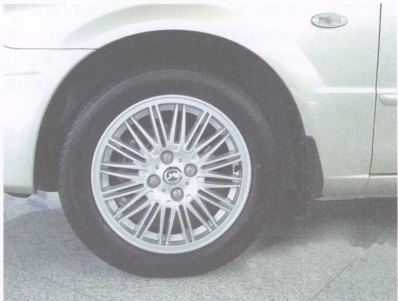
一辆车一天往返深港4次

由于深港两地轮胎差价大，再加上内地对进口车胎需求量大，一些粤港两地牌照车司机瞅准机会，想出了新胎换旧胎走私的办法，在香港将小车全部装上新轮胎后，在极短时间内驶往深圳“脱胎”，换上“残废胎”，再驶回香港。