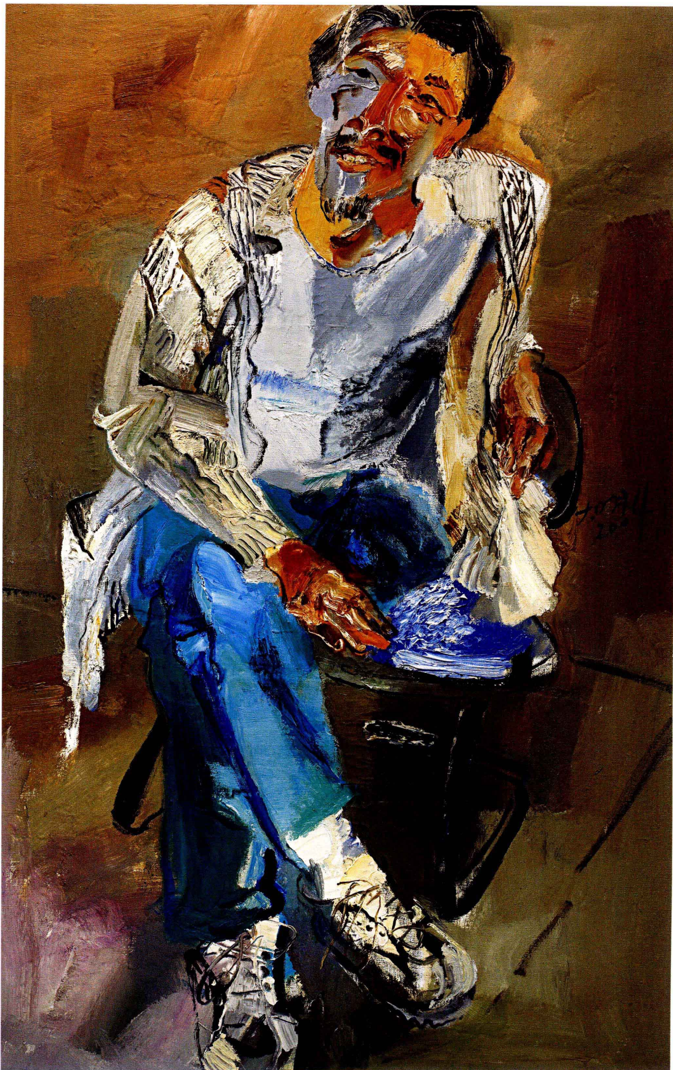
刘大明 醉酒的老侯像 140cm × 90cm 布面油彩 2004年