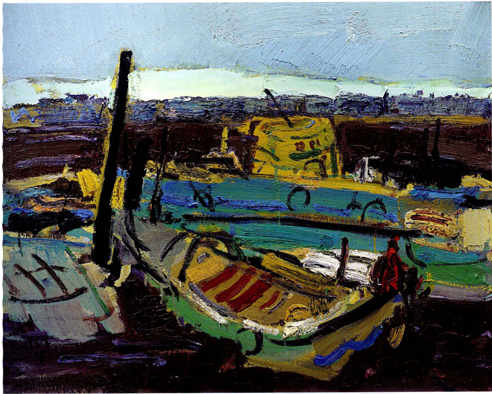
张立平 退潮 80cm × 100cm 布面油彩 2008年