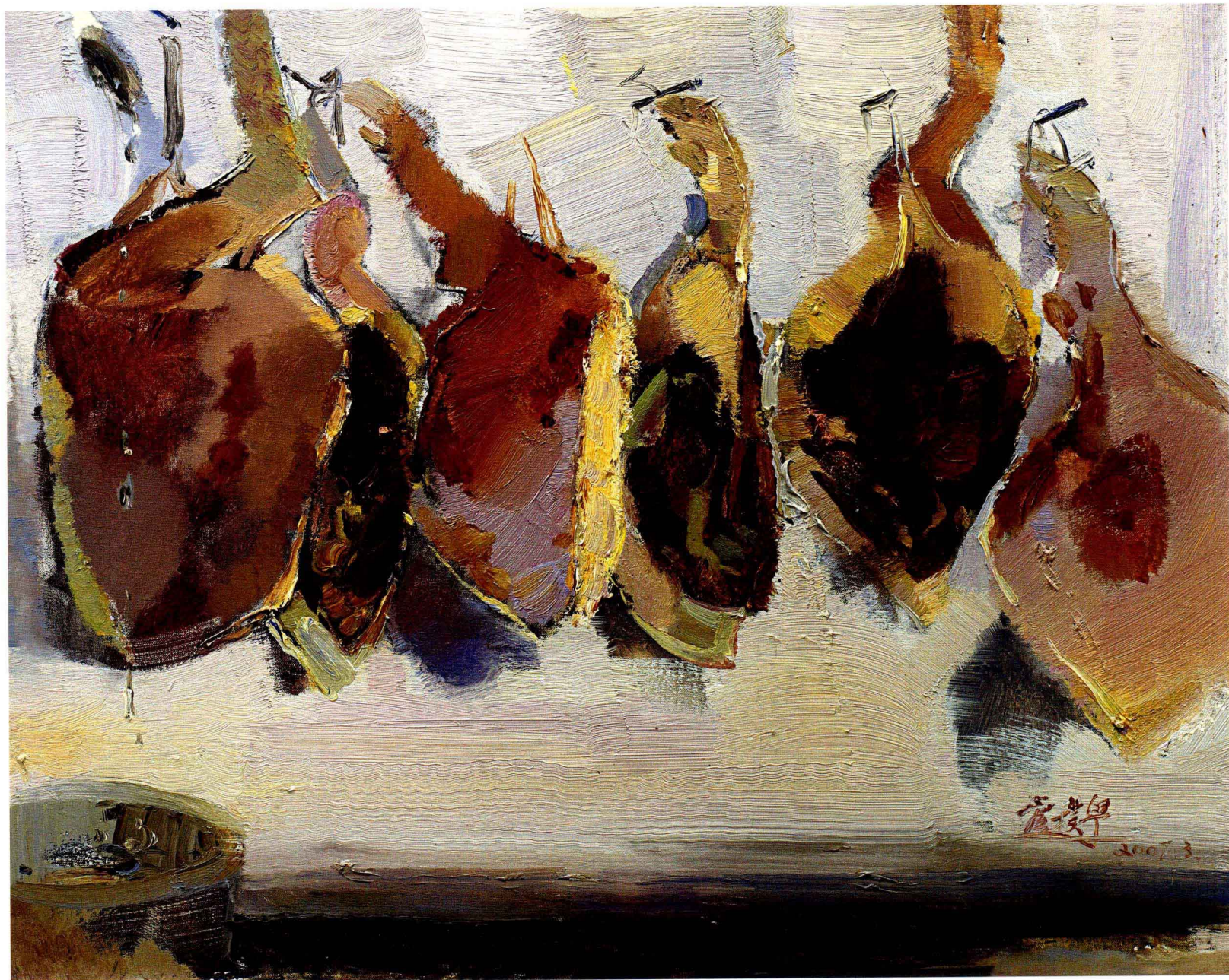
管朴学 腊肉 65cm × 85cm 布面油彩 2007年