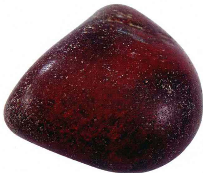
和田名贵红玉仔料陨石