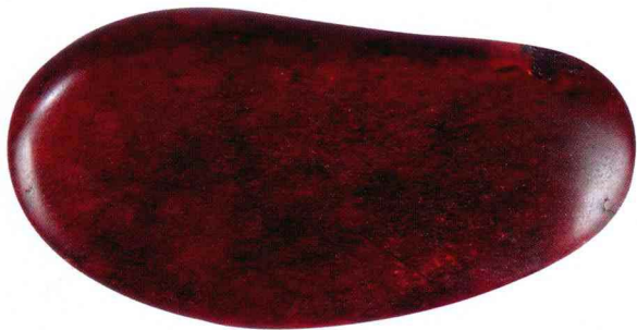
和田名贵红玉仔料跳动的心