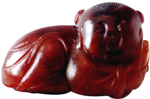
和田红玉仔料玉人