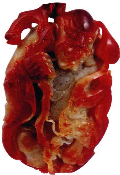
和田红玉仔料降龙罗汉

中国玉文化历史悠久，无数精美绝伦的中国玉器向世人不断诉说着中国玉文化的灿烂历史，不但中国古玉器有无限的生命力，而且中国现代玉器仍然释放着璀璨的民族艺术光芒。2008年举办的北京奥运会，用和田青玉做奥运徽宝（也称中国印），用青海昆仑玉做奖杯。把中国玉器的艺术魅力淋漓尽致地展示给全世界，也充分说明中国人有爱玉、崇玉、敬玉、藏玉、品玉、玩玉的美好心灵。