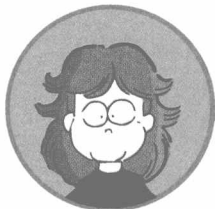
松本真澄 (まつもとますみ) 主婦