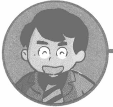
斉藤さん (さいとうさん) 近所に住んでいる人