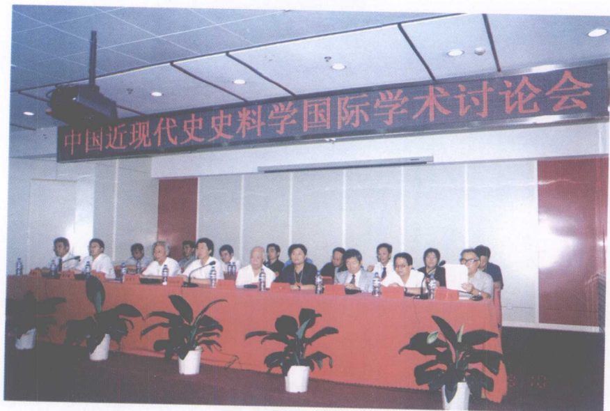
讨论会开幕式主席台