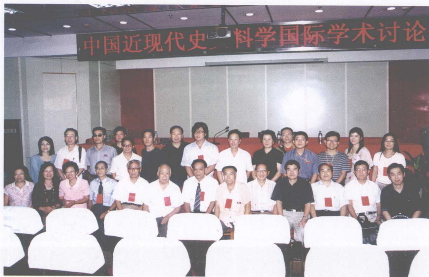
学会负责人与台湾学者留念