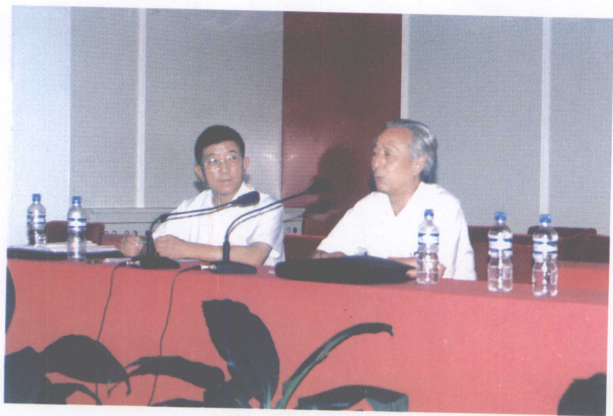
讨论会大会报告与发言