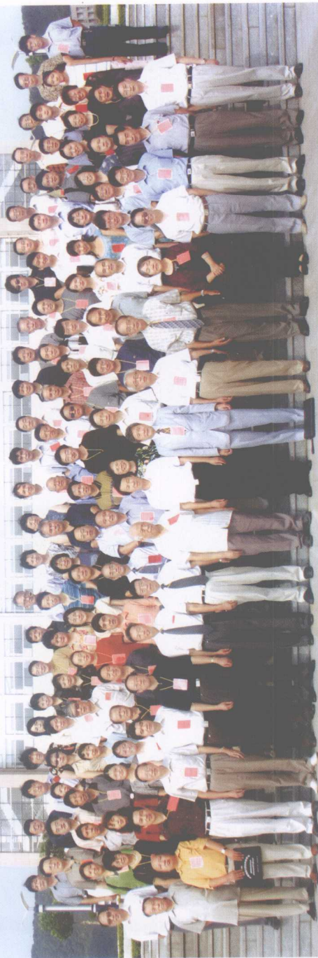
中国近现代史国际学术讨论会与史学会合影