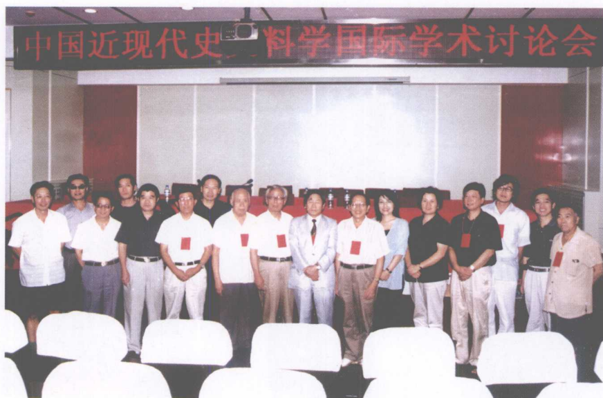
学会负责人与国外学者留念