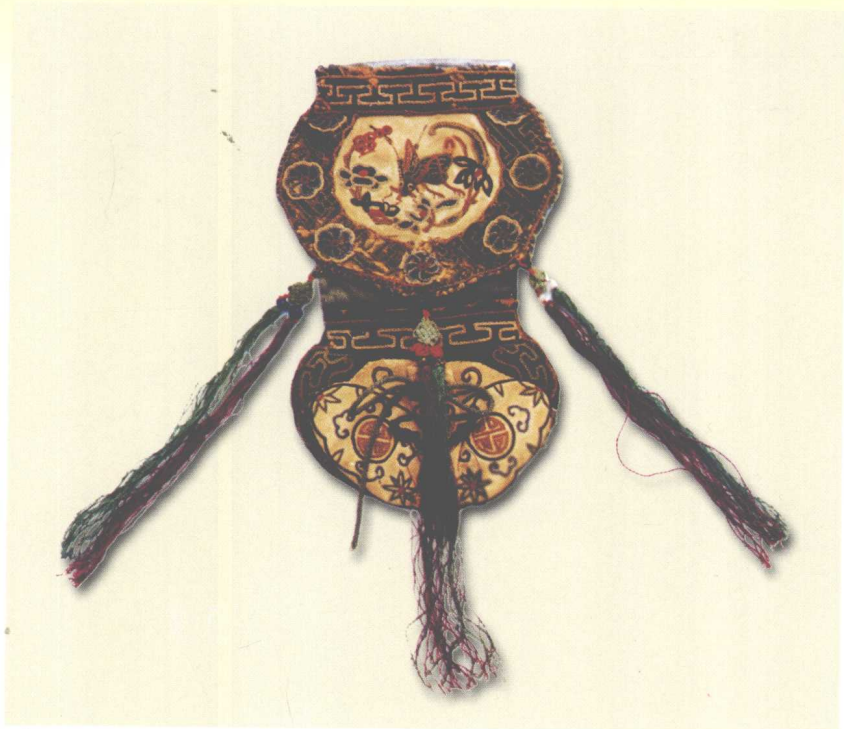
褡裢荷包 画面有两幅 题材各不相同

的样子做成的荷包。眼镜荷包既是盛装眼镜的容器，又标榜主人文雅，实乃文人的一种吉祥物。香坠是荷包的一种，略小，造型有石榴、寿桃、佛手、花篮、金鱼、山形等，不少图案带有象征意义。