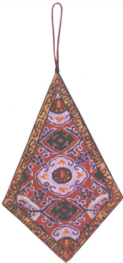
清宫收藏 白纱纳锦绣 四出锦纹褡裢