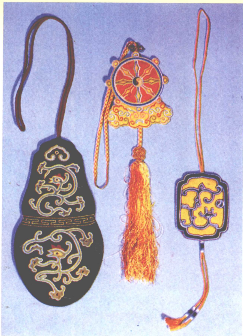
清宫收藏黄缎緝线绣夔龙香袋（右） 清宫收藏红缎緝线绣轮云香袋（中） 清宫收藏青缎緝线绣夔龙香袋（左）