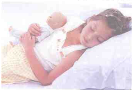
大多数人一生中的睡眠问题超过生命的1/3

有意思的是,这张床还具有神奇的“止鼾”功能。床垫中的振动感应器和受压测试系统,不仅知道主人是否在打呼噜,还能知道主人熟睡时是否好动,并由此通过计算机