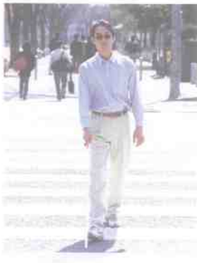
视觉盲人靠手套出行

盲 人有先天盲人与后天盲人之分，大多是眼睛患有疾病或受到意外伤害而导致双目失明或单目失明。不过盲人也有“看”的功能。这种“看”的功能，表现在他会通过其他器官感知世界。例如，世界的图景被转化为盲文之后，盲人通过触摸“读”书，他们便可以在文字的