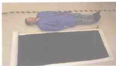
世界上最大的碳管“被单”只够供一人使用

际空间站返回地球的装置。不过他们没有公布制造“太空电梯”的材料。后来，英国技术人员率先提出了他们的方案。