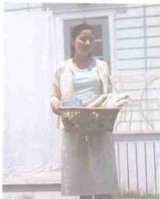
普通纺织品需清洗才能保持整洁

随着纳米技术的发展,澳大利亚和中国科学家已研制出一种自洁纤维,用它制造的衣料具有见光自洁特性。研究人员解释说,沾有红酒的自洁毛料经过几分钟光照,红酒污渍开始褪色,晾晒一天之后,酒渍完全消失。