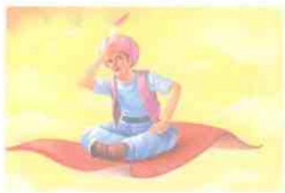
《一千零一夜》中的“魔毯”

动就会在毯子和底面之间的裂缝处产生很高的压力。研究人员说：“当波动的毯子沿着柔软的衬箔运动时，就会使流体产生流动，导致产生压力，从而将衬箔平衡升起。”当它已经升起后，波动力量就会推动衬箔前进，这就是闻名遐迩的魔毯的特性。