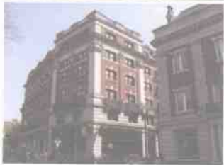
美国哈佛大学校园风景