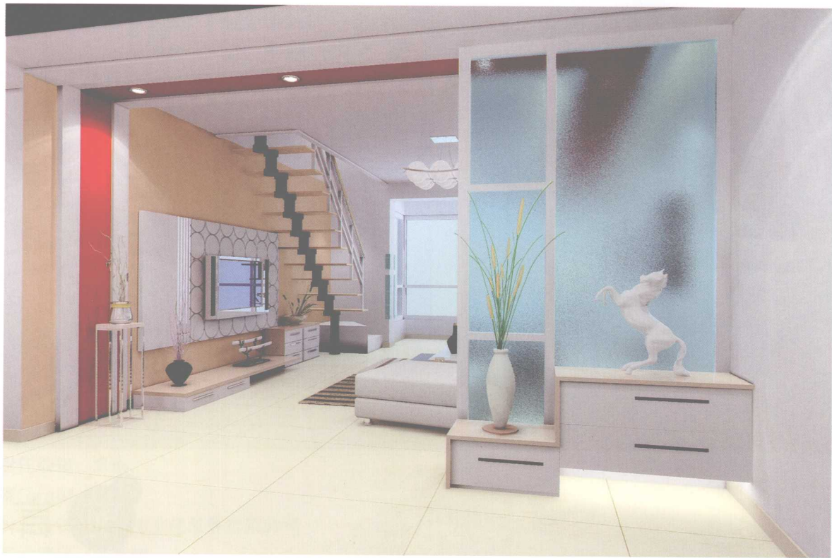
★半通透式的玄关背景墙，将客厅的美景巧妙地隐藏在玻璃背后，让人有一探究竟的冲动。