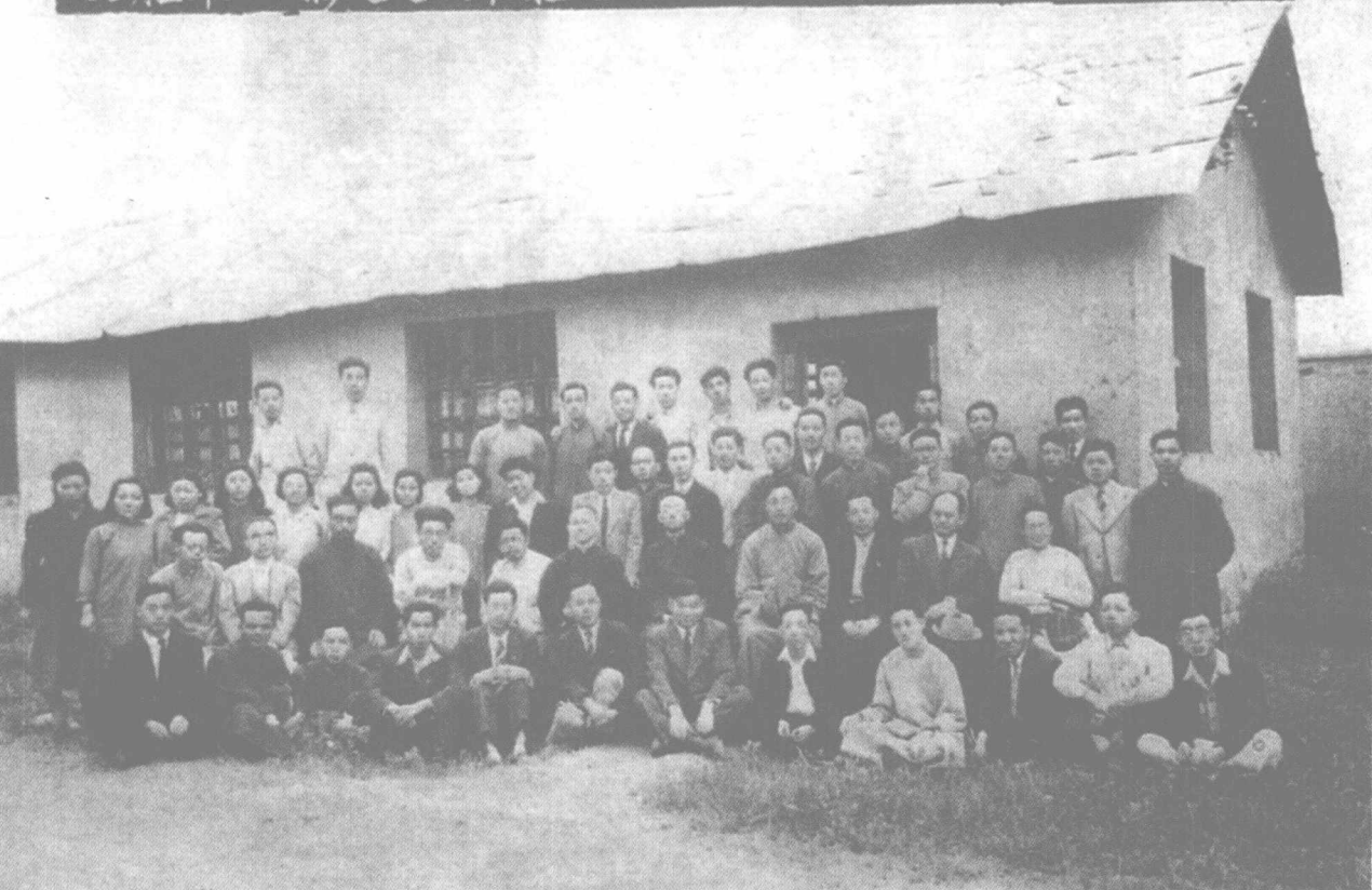
1946年，冯友兰与西南联合大学中国文学系全体师生合影。第二排左三为冯友兰，左二为朱自清，左四为闻一多。