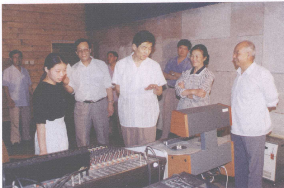
原国家广播电影电视总局局长田聪明（左三）来院视察