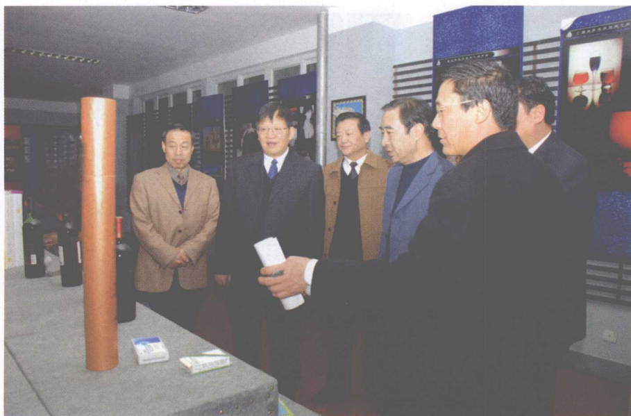
国家广播电影电视总局副总编金德龙（左二）来院指导