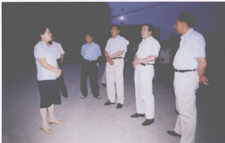
山西省政协主席（时任省委副书记）金银焕（左一）来院视察