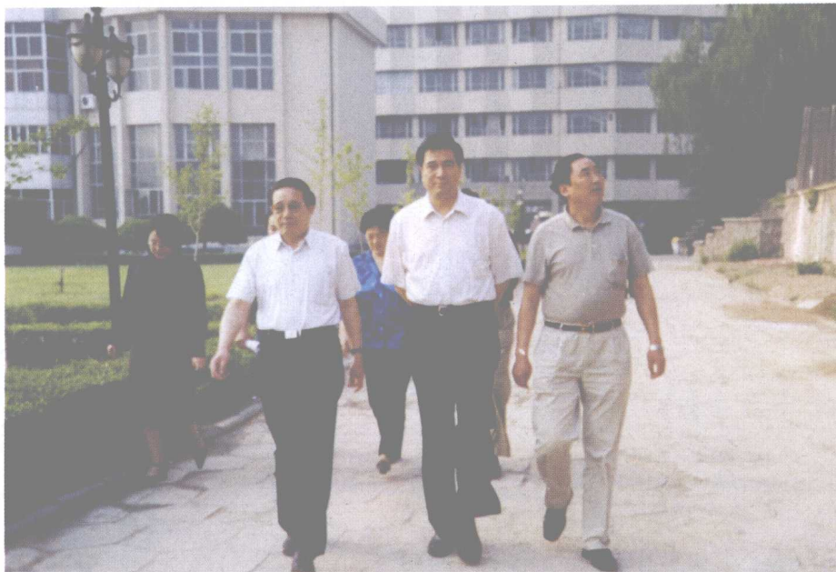
山西省委常委、太原市委书记申维辰（右二）来院视察