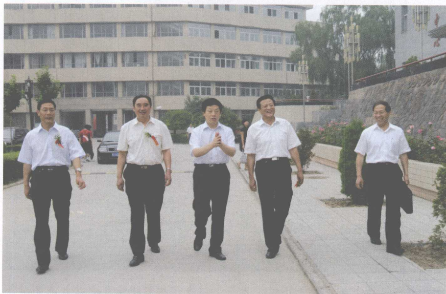
山西省副省长张平（左三）来院视察