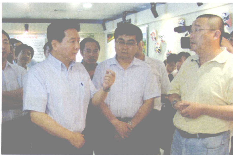
山西省委常委、副省长李小鹏（左一）视察学院影视信息中心太原高新区分部动漫作品展