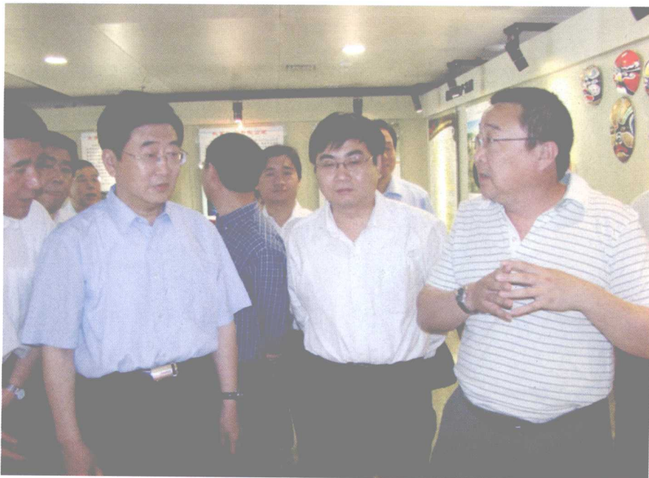
山西省委副书记、省长孟学农（左一）视察学院影视信息中心太原高新区分部创意作品展