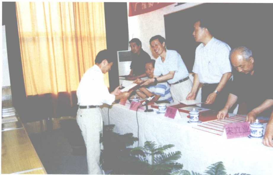
国家广播电影电视总局副局长雷元亮来院视察（右三）