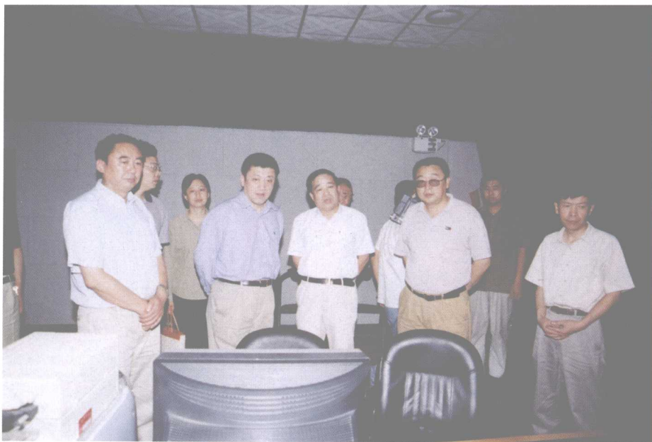
国家广播电影电视总局副局长张海涛（左二）来院视察