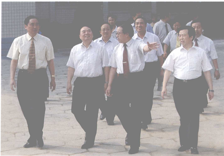
国家教育部部长周济（左二）来院视察