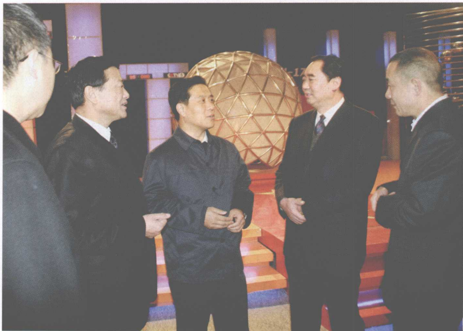
山西省委常委、宣传部部长高建民（右三）来院视察