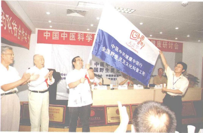
原中国中医科学院院长傅世垣，原国家医药管理总局常务副局长关舟向作者授予“中国中医健康中国行全国野生灵芝文化科普工程”的旗帜