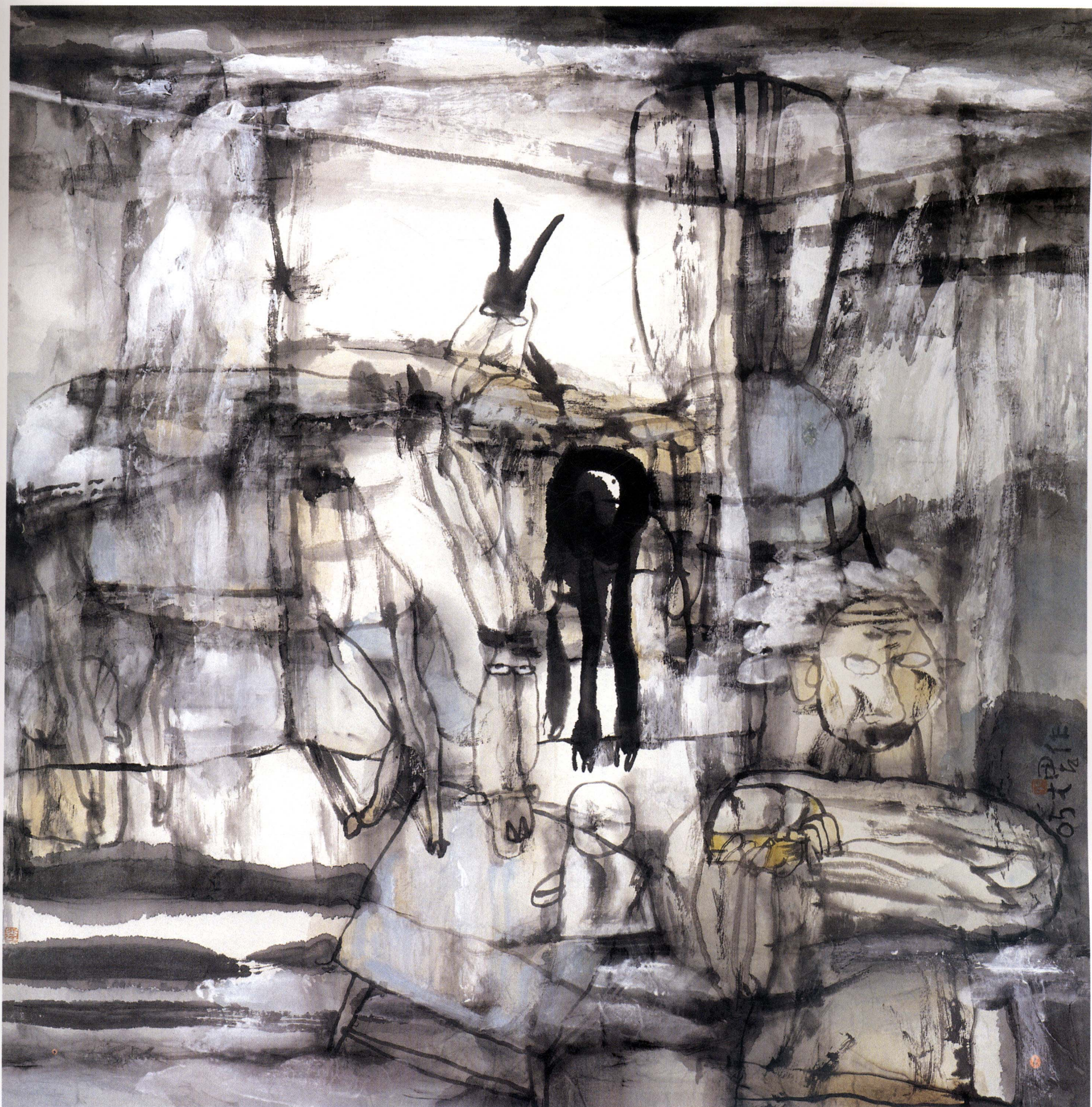
村里的故事 68cm × 68cm