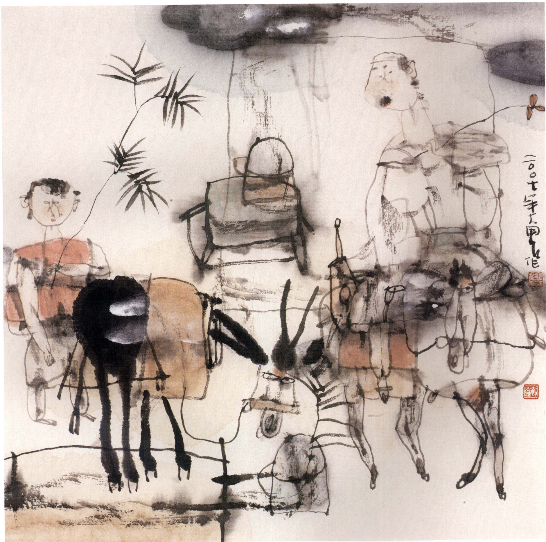
一大一小 33cm × 33cm