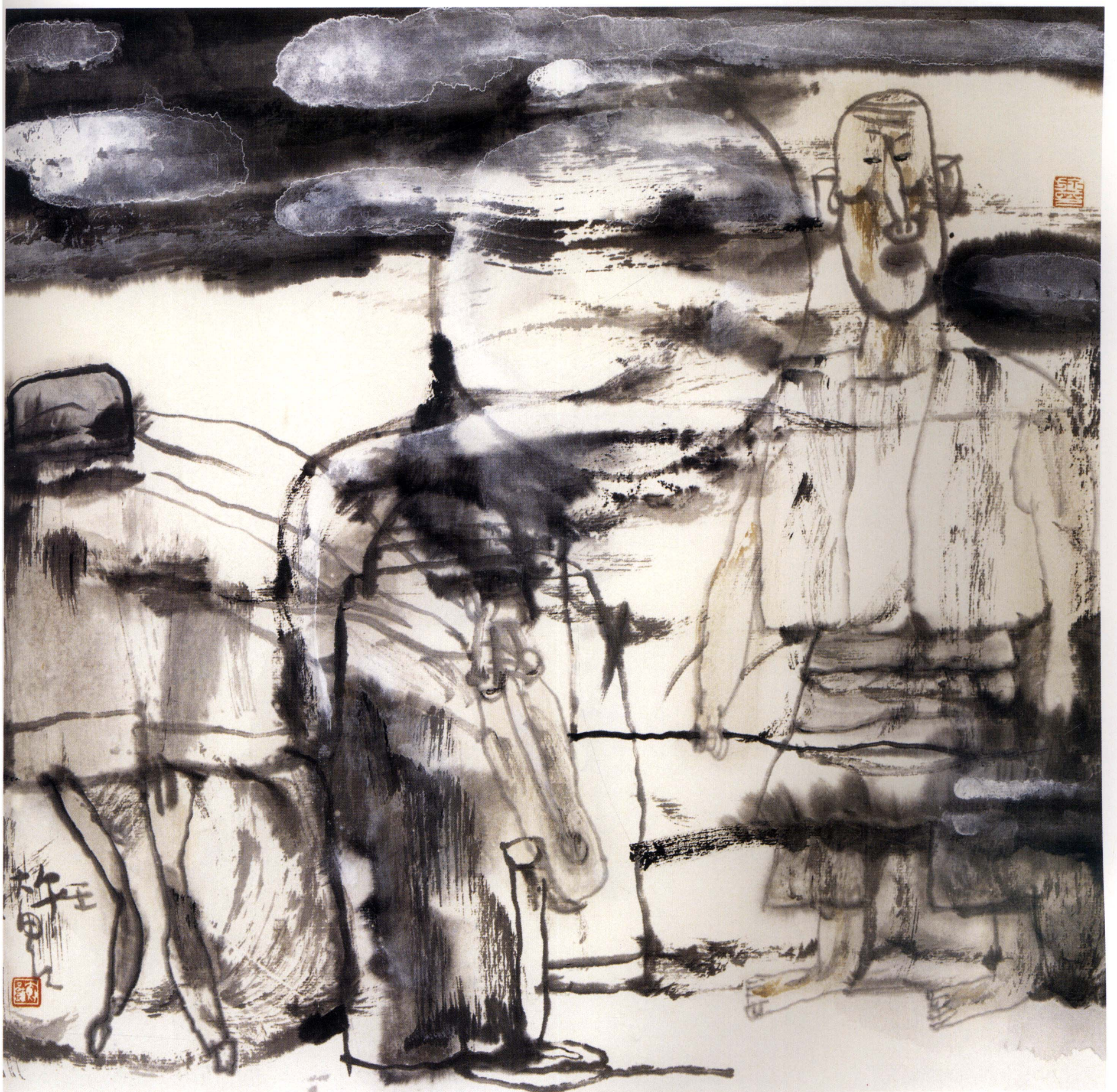
月色 33cm × 33cm