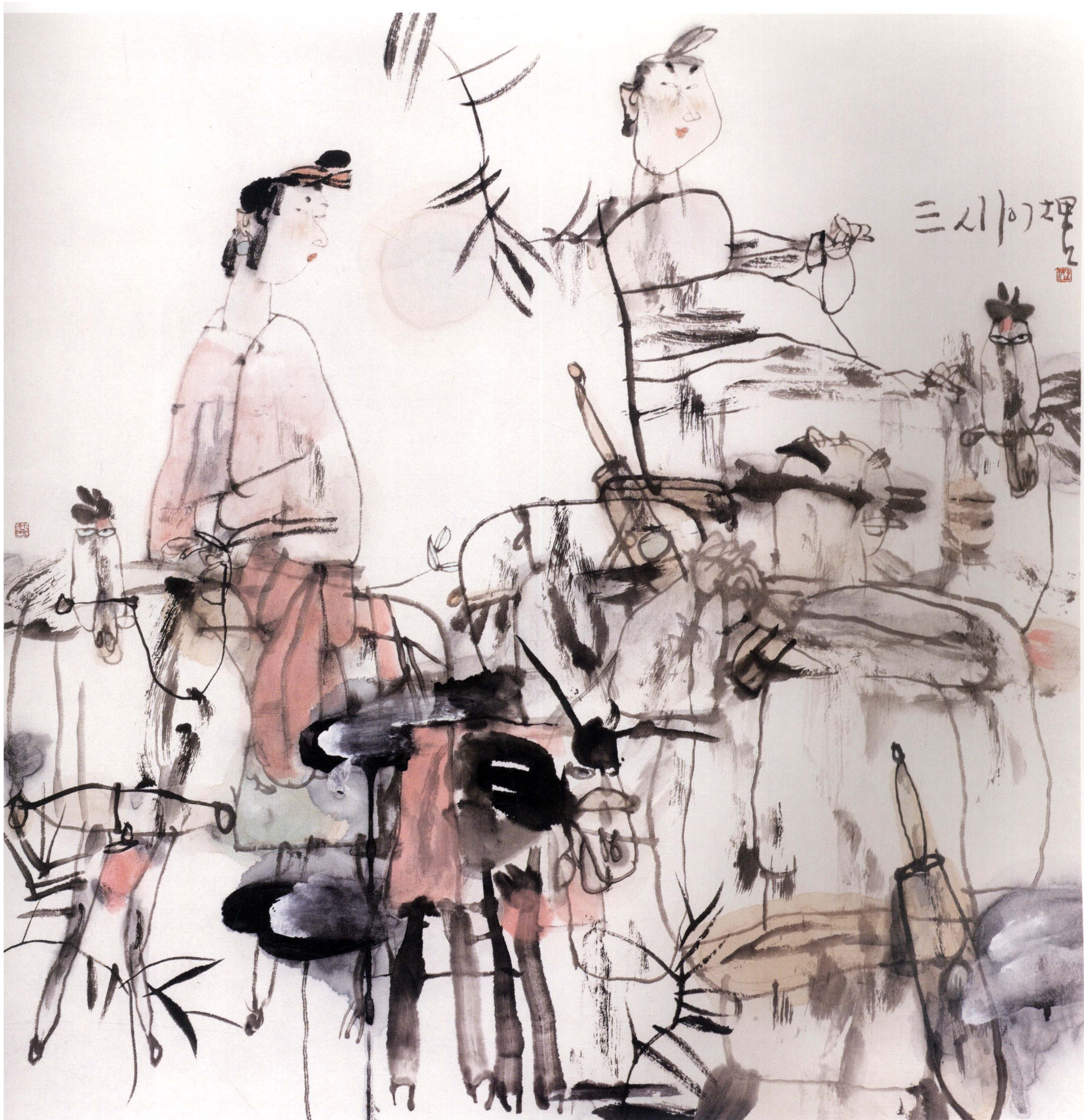
三人行 33cm × 33cm