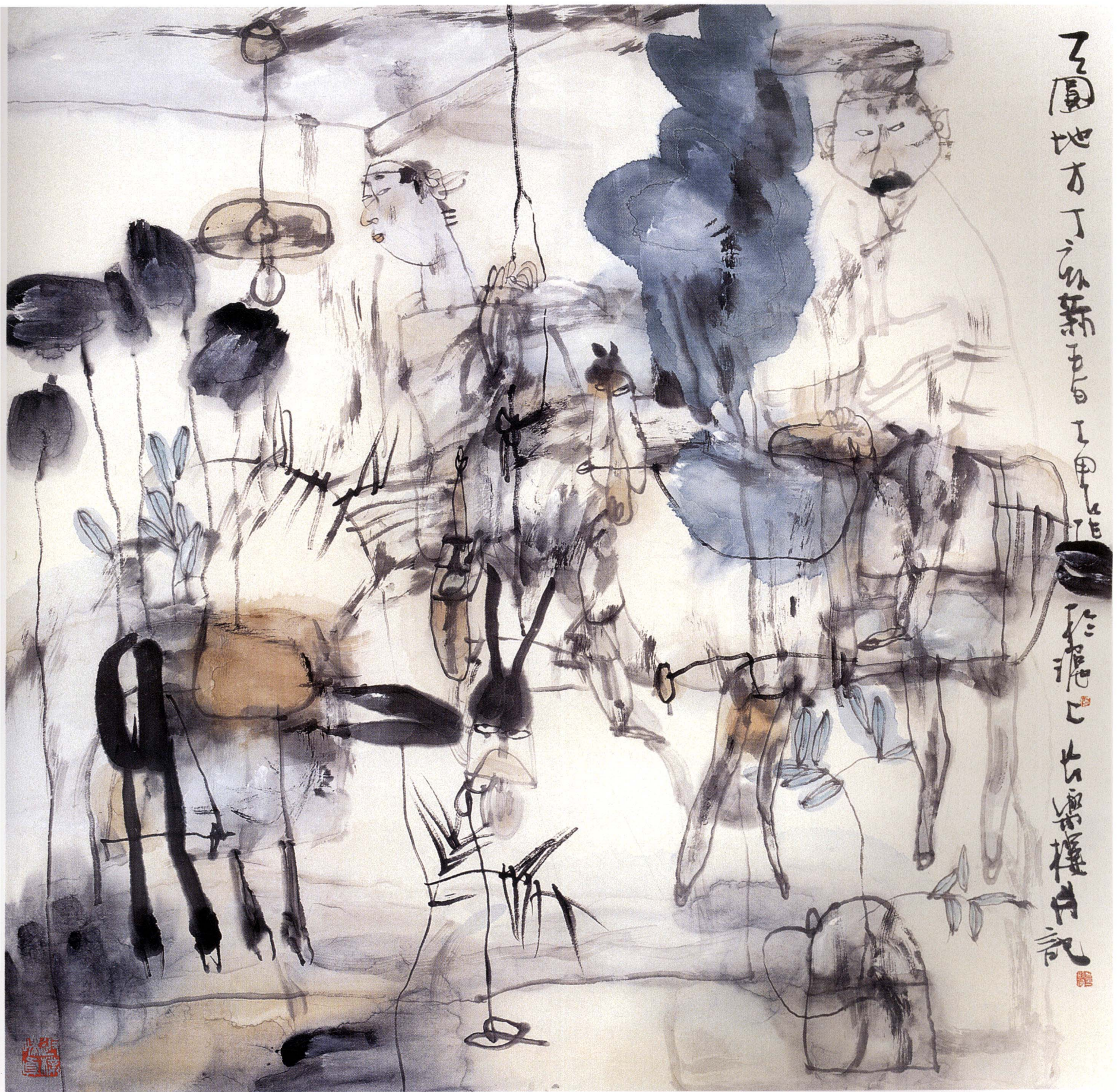
天圆地方 33cm × 33cm