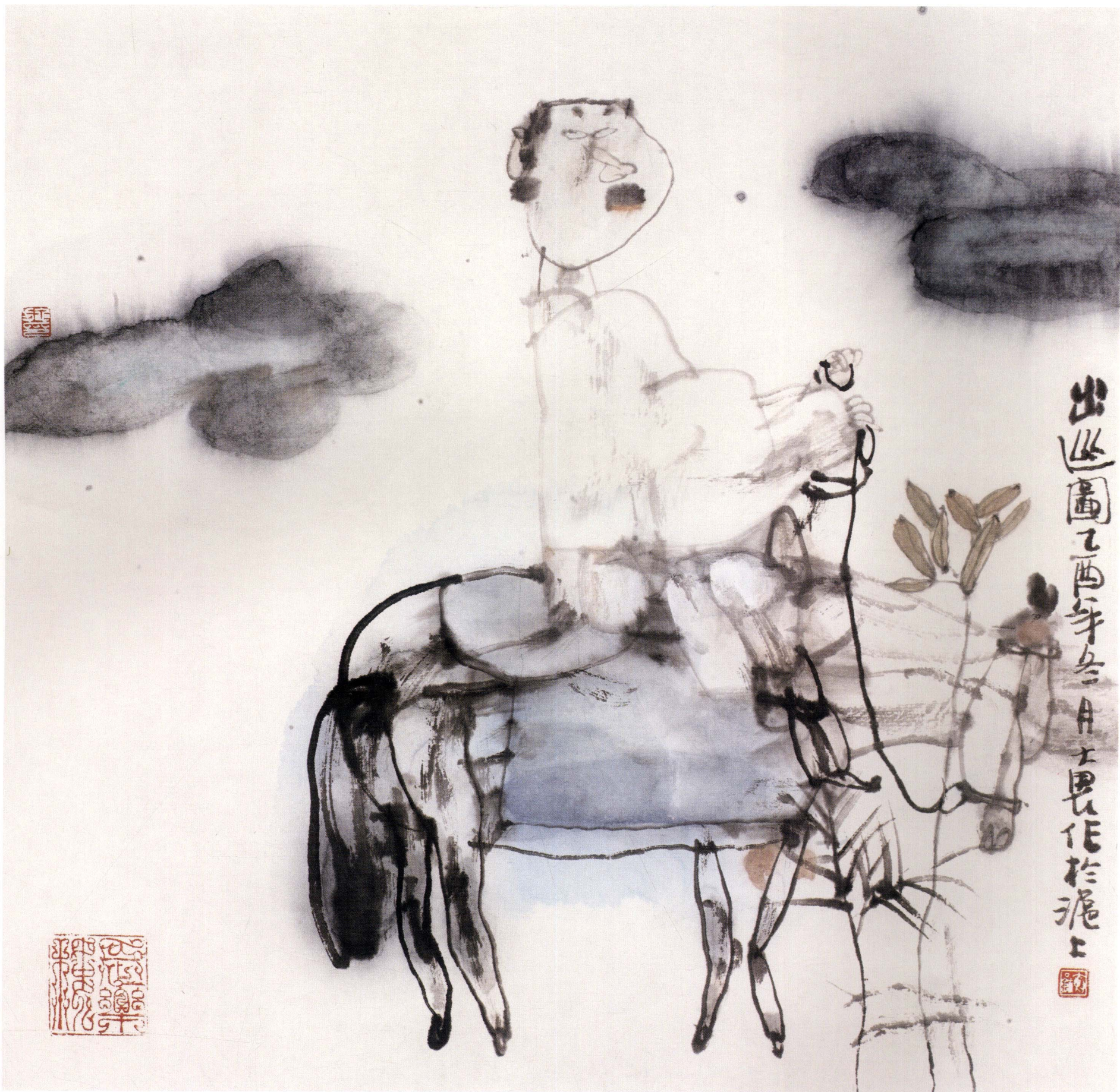
出巡图 33cm × 33cm