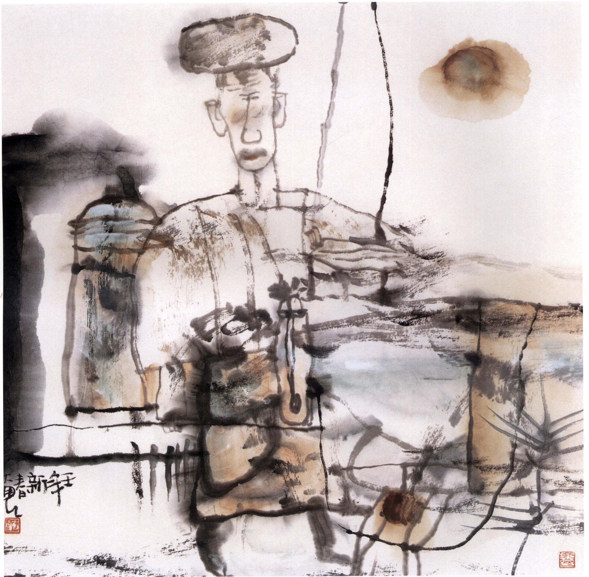
无题9 33cm × 33cm