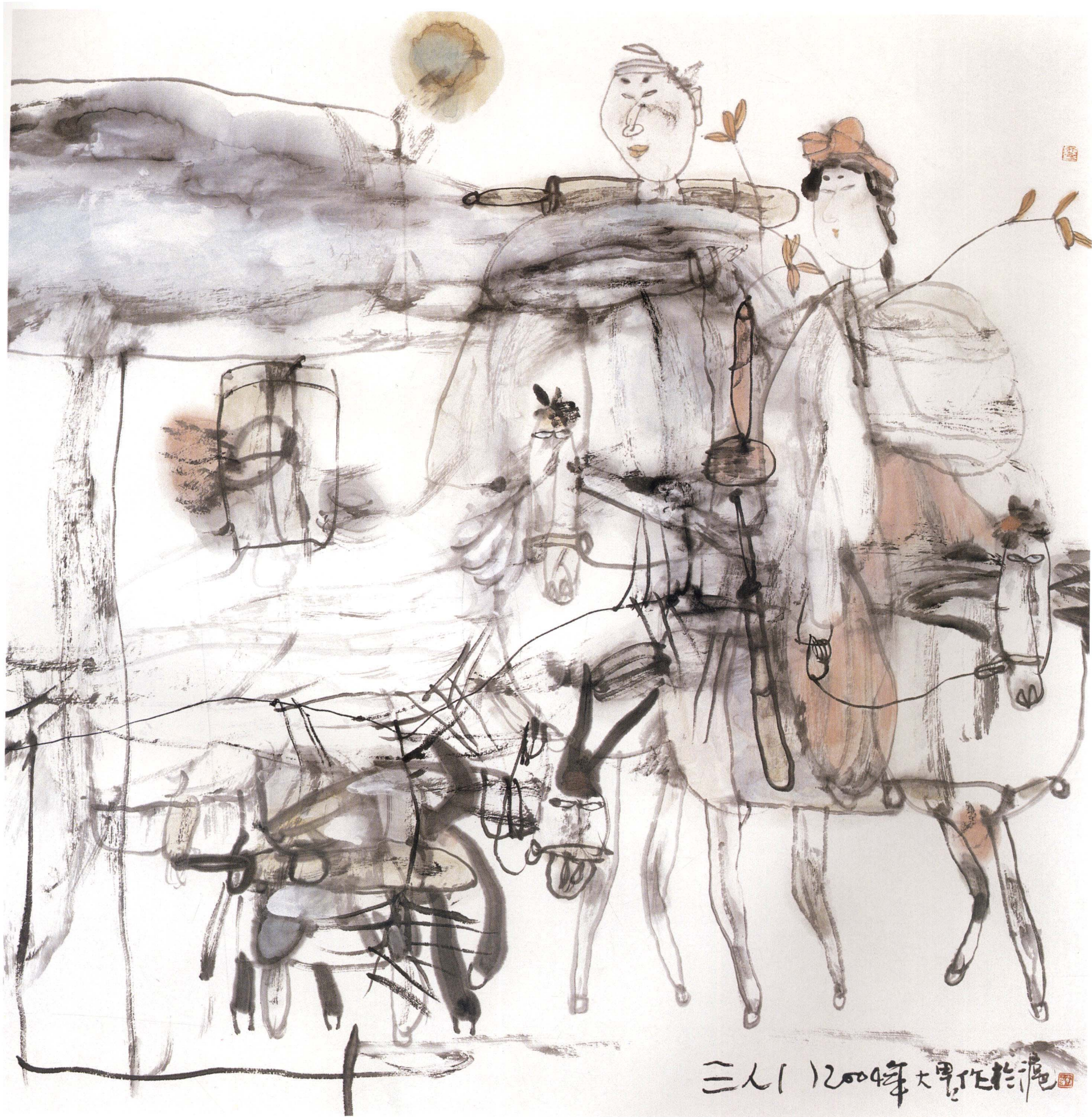
三人行 68cm × 68cm