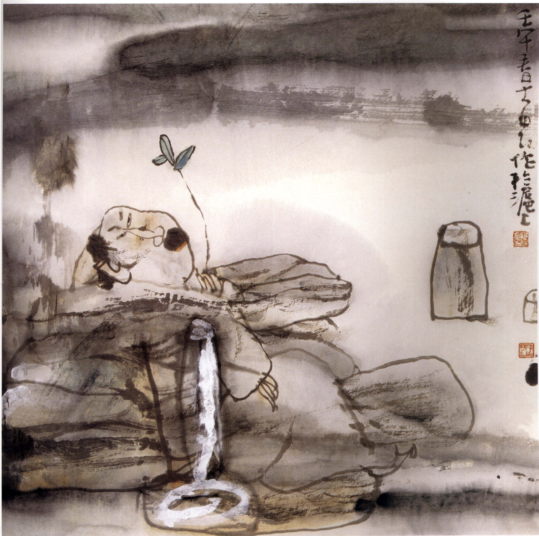
醉酒 33cm x 33cm