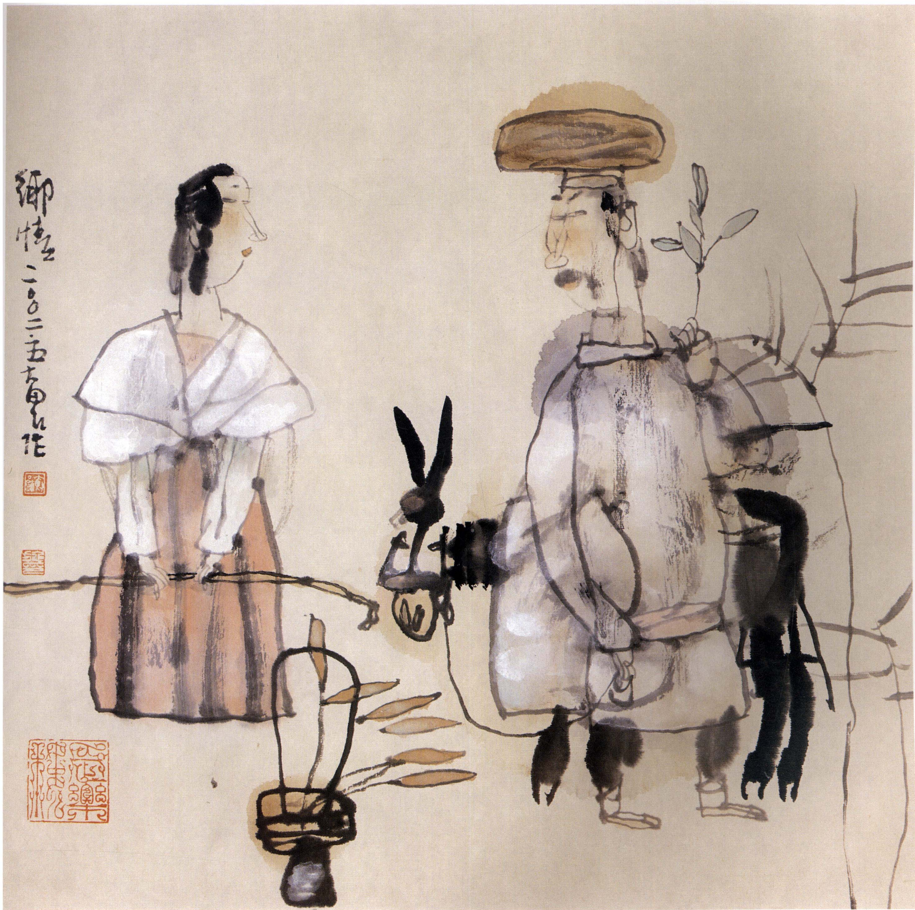
乡情 33cm × 33cm