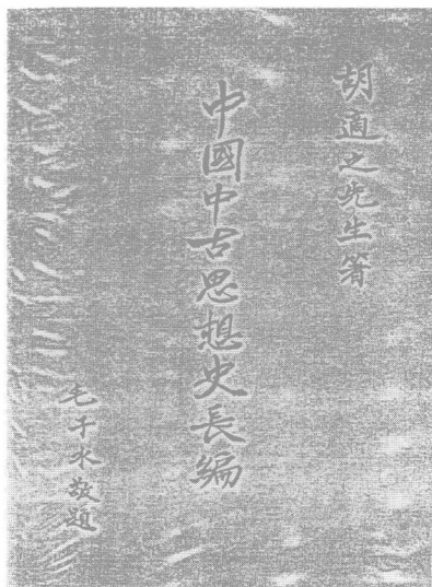
◎ 《中国中古思想史长编》 初版书影