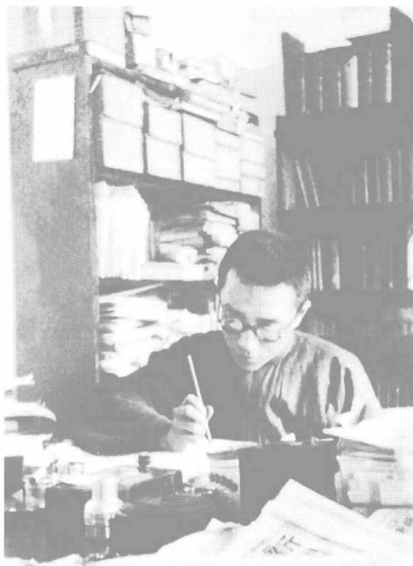
◎ 初任北京大学教授的胡适(1917年秋摄)