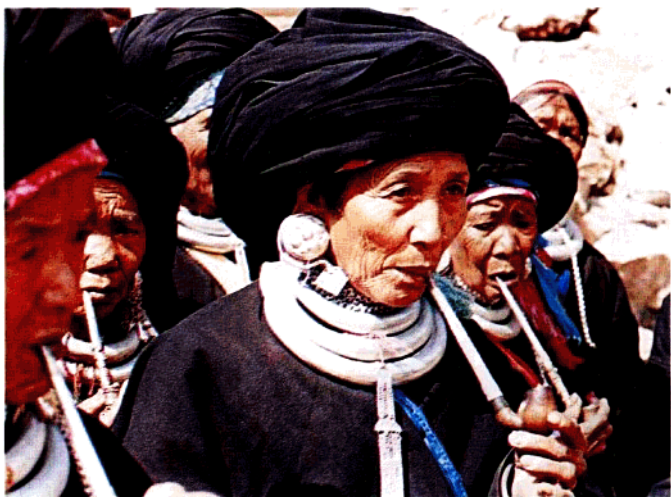
佤族老年妇女头饰