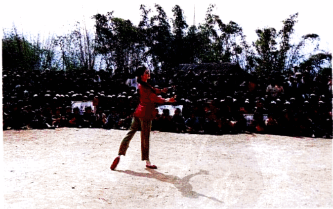
上海手拉手艺术团赴佤山慰问演出