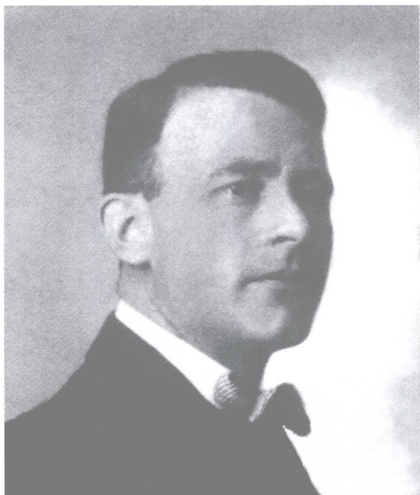
卡尔·施米特 (Carl Schmitt, 1888-1985)