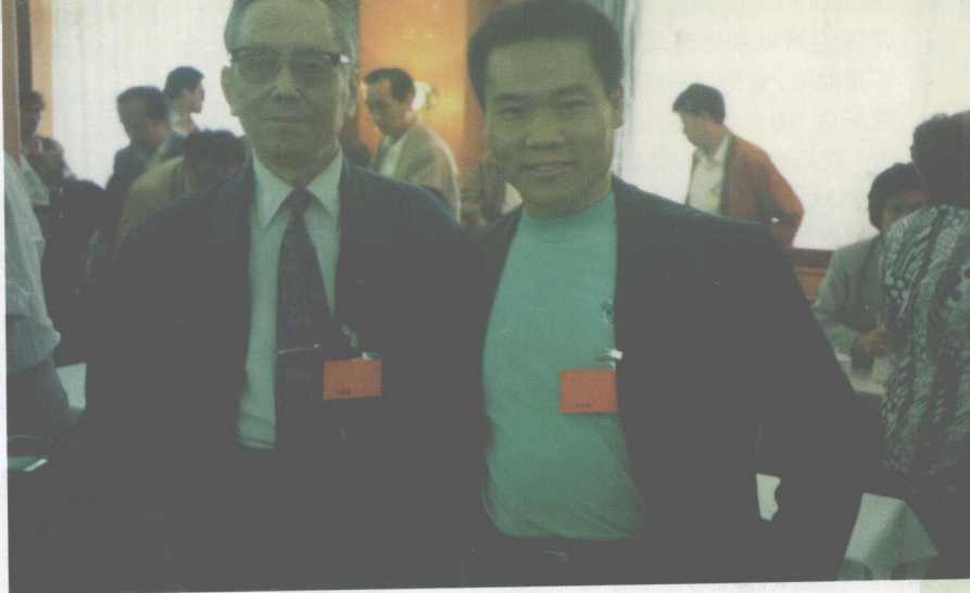
1995年夏出席反对封建迷信捍卫科学尊严研讨会，与大学者任继愈老先生合影