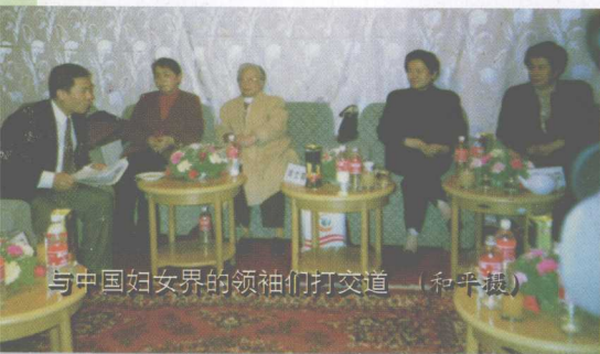
与中国妇女界的领袖们打交道