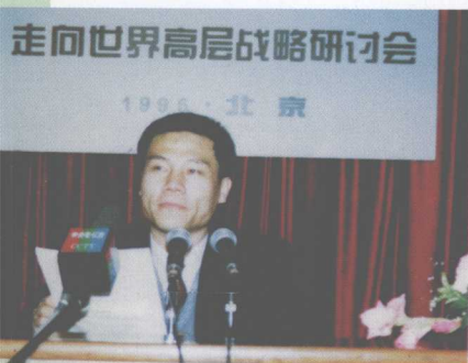
主持会议的司马南，人说他一脸傲气