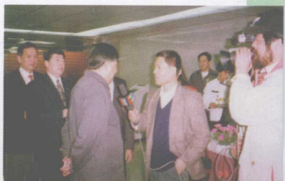
在深交所大厅采访四川省副省长马麟