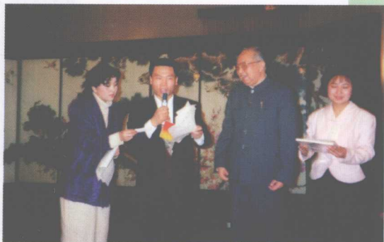
人民大会堂春节联欢会，司马请老同志一起参 与节目表演，台上台下一起“科普”