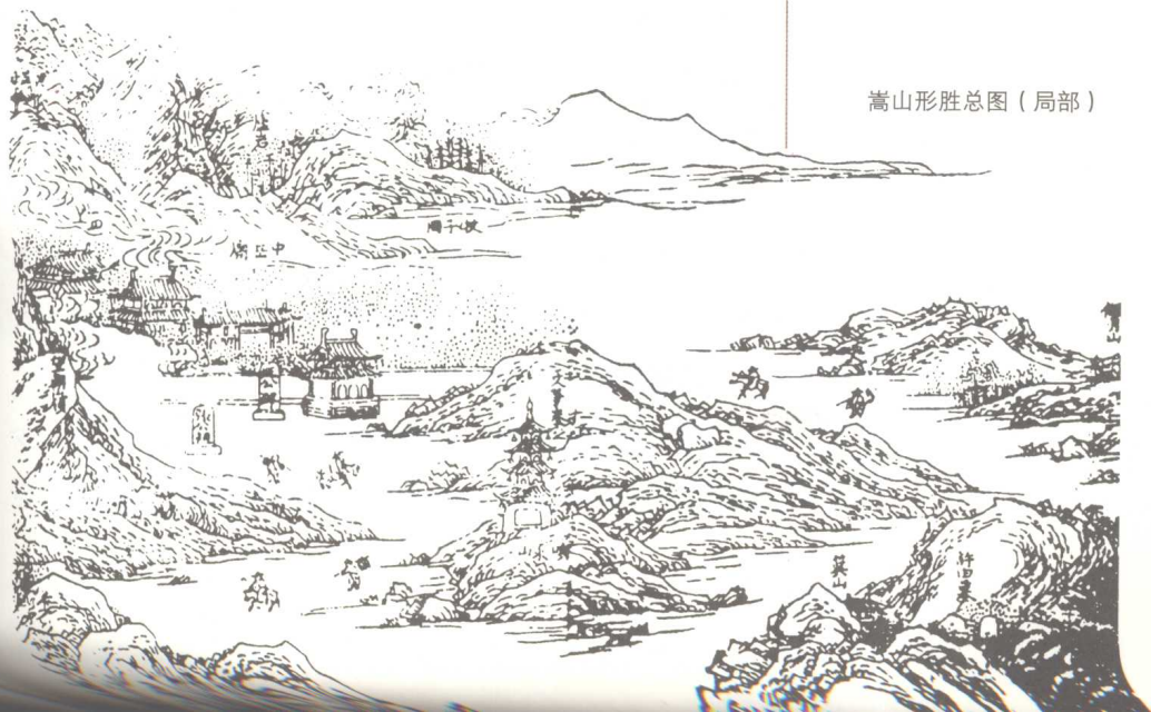
嵩山形胜总图（局部）

人类的信仰始于天和地。远古时代的先民称天为父、地为母。后来的信仰崇拜有了具象物体，比如生殖崇拜，鸟、兽、山川河流等。再往后是建庙宇、寺院、塑泥胎的神灵崇拜。老百姓说：“糊添麻缠”成神。在嵩岳大地，先民们具象的图腾崇拜是嵩山脚下的启母石。4000多年前