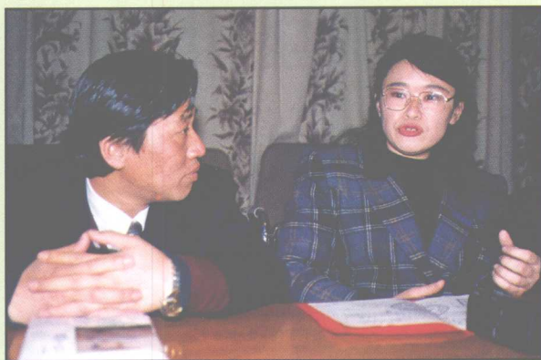
姜伟和张海迪在一起