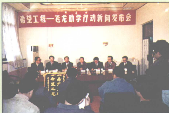
飞龙捐资修建14所“希望小学”新闻发布会