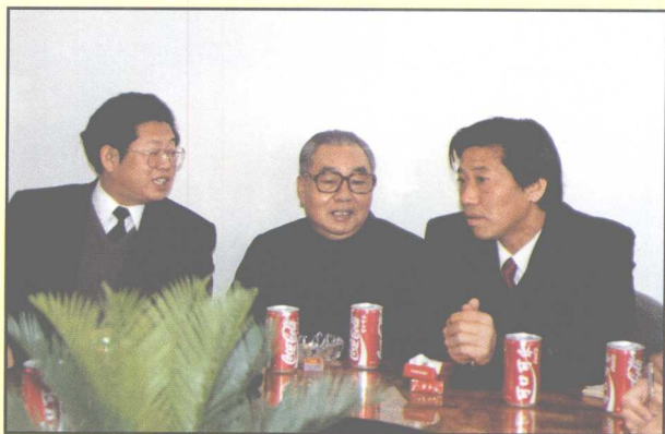
姜伟在向原辽宁省委书记岳岐峰，原沈阳市委书记张国光汇报工作