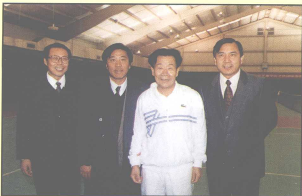
姜伟与中共中央政治局常委、全国政协主席李瑞环合影