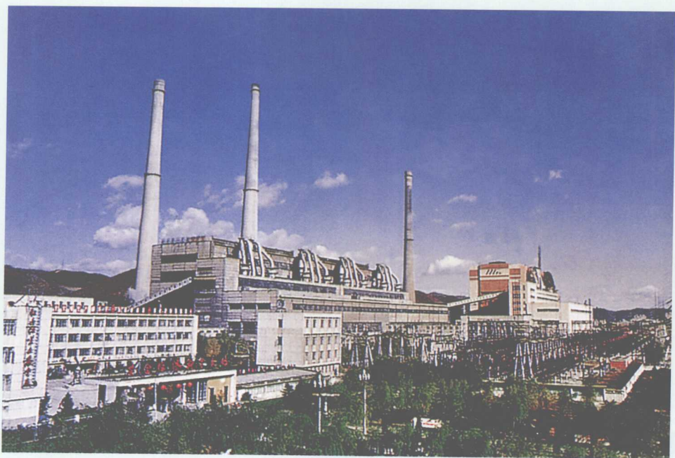
■ 黑龙江牡丹江第二发电厂外景。