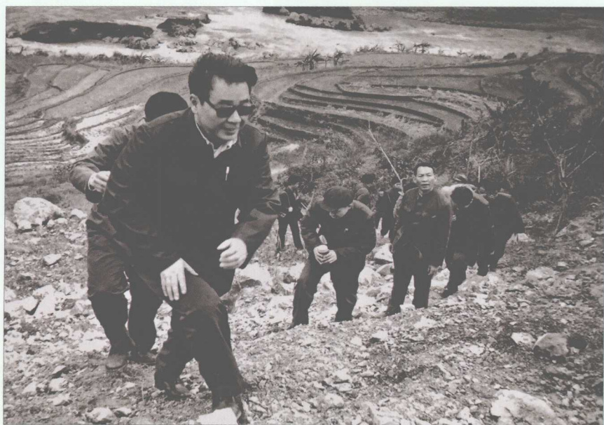
■ 1983年3月3日，李鹏考察广西天生桥二级水电厂工地。