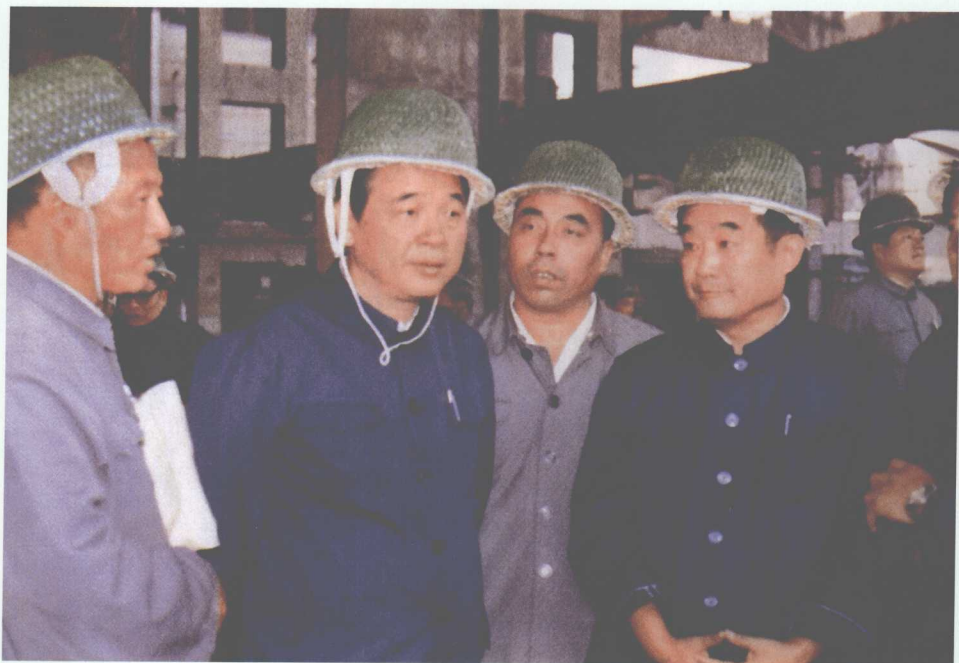
■ 1983年9月20日，李鹏视察辽宁锦州发电厂。