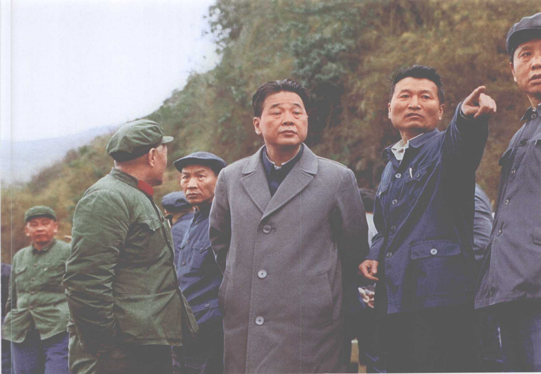
■ 1983年2月26日，李鹏视察广西红水河岩滩水电厂工地。