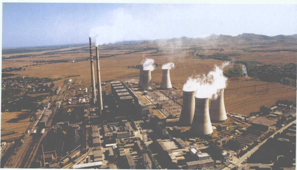
■ 辽宁锦州发电厂俯瞰。