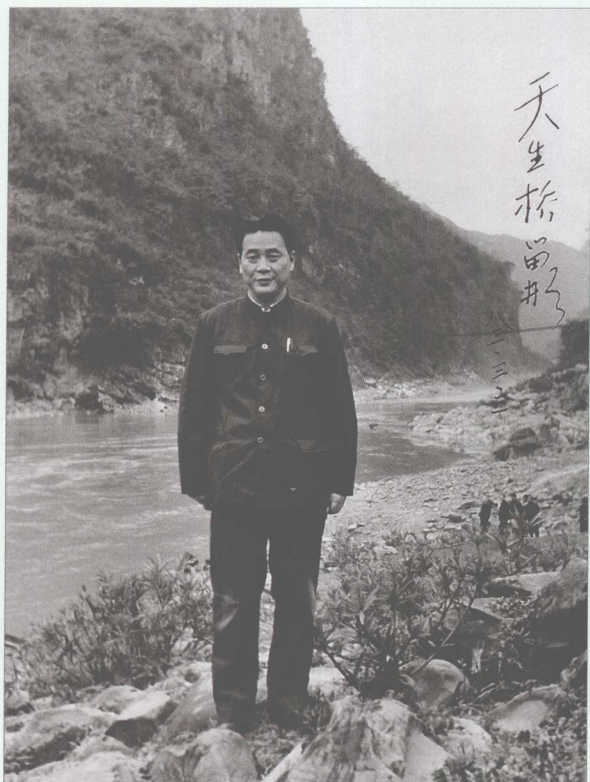
■ 1983年3月3日，李鹏在广西天生桥水电厂工地留影。