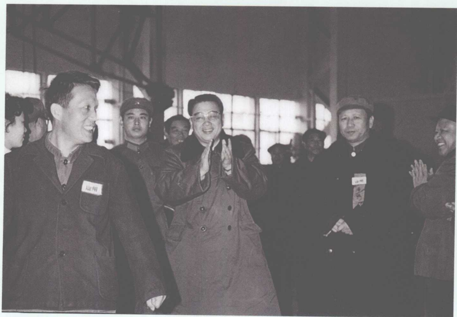
■ 1983年12月29日，李鹏视察河北唐山陡河发电厂，并为5号机组投产剪彩。