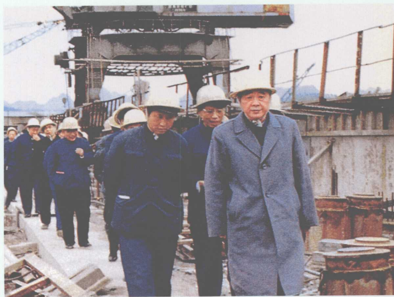
■ 1983年2月26日，李鹏视察广西大化水电厂工地。