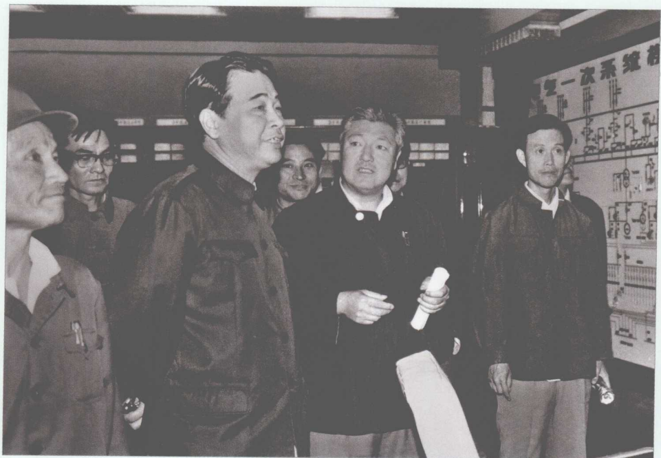
■ 1983年9月12日，李鹏视察黑龙江牡丹江第二发电厂。