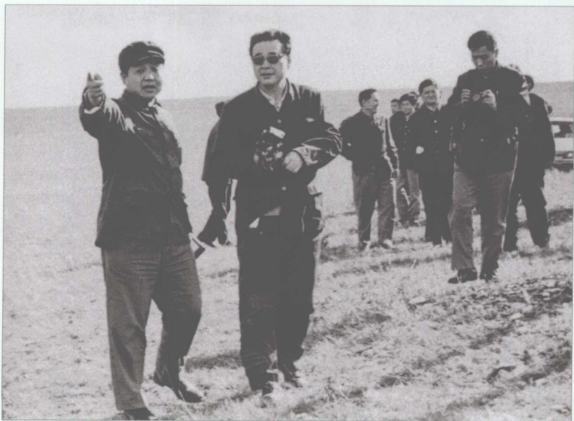
■ 1983年9月3日，李鹏视察内蒙古伊敏矿区。