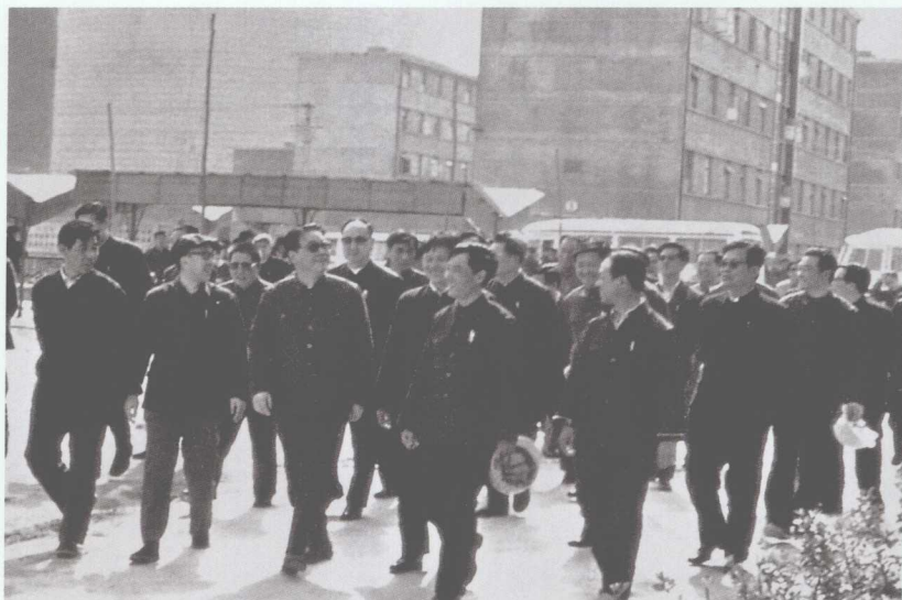
■ 1983年10月23日,李鹏(前排左三)视察山东邹县发电厂一期建设工地。