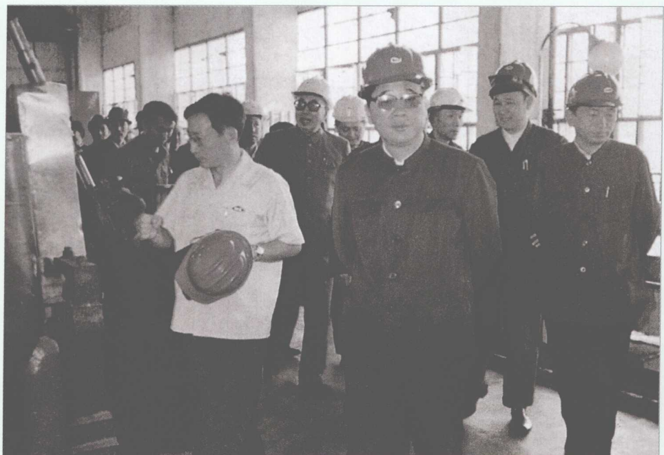
■ 1983年9月5日，李鹏视察黑龙江富拉尔基发电总厂。