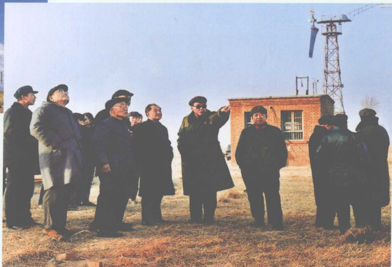
■ 1983年1月2日,李鹏陪同胡耀邦视察北京八达岭风力发电试验站。左上图为试验站一角。