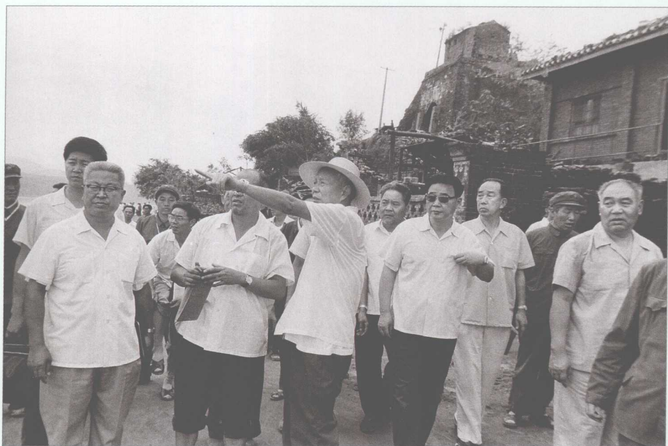
■ 1983年8月，水淹陕西安康后，万里（前排左三）、李鹏（前排左四）到灾区视察。