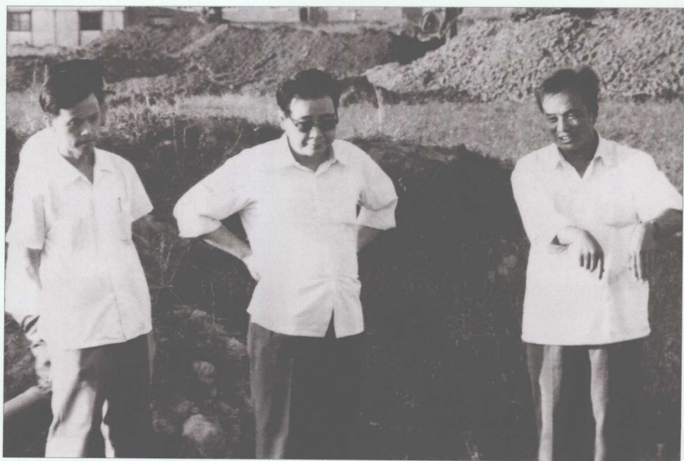
■ 1983年9月7日，李鹏视察哈尔滨第三发电厂施工现场。