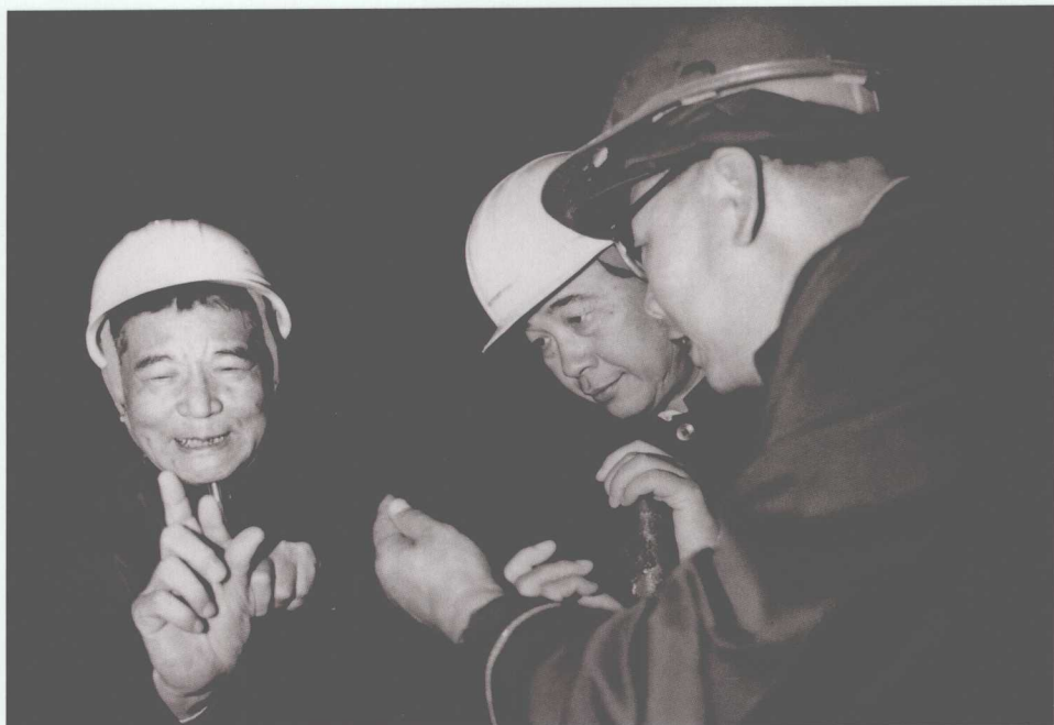
■ 1983年9月15日，李鹏在吉林白山水电厂工地与职工亲切交谈。