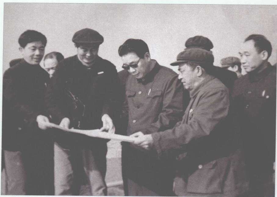
■ 1983年12月16日，李鹏考察浙江北仑发电厂厂址，预言这里将是南方最大的火力发电基地之一。