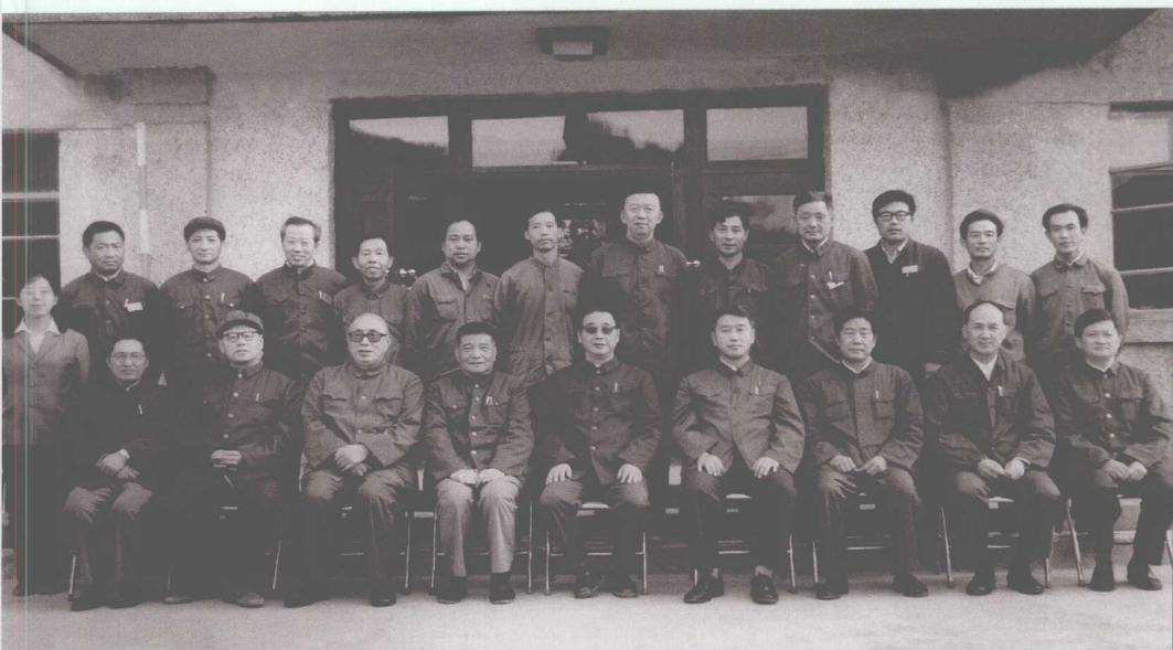
■ 1983年9月15日，李鹏到吉林白山水电厂工地视察时与有关同志合影。 (前排右起：姚振炎、黄毅诚、刘书田、高德占、李鹏，右七：高扬文， 右九：赵维臣)