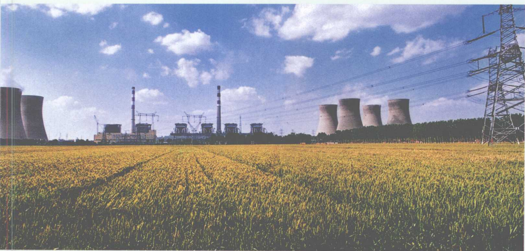
■ 山东邹县发电厂远景(装机 4 \times 30 万千瓦 + 2 \times 60 万千瓦)。