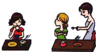
active 主动的 passive 被动的

['æktɪv] adj. ①忙碌的, 活跃的②积极的, 主动的 (≠passive) ③(思想等)充满活力的④起作用的, 活性的, 有效的: an active volcano 活火山