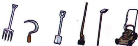
fork 干草叉 sickle 短柄镰刀 shovel 铲, 锹 hoe 锄头 rake 耙子 lawn mower 割草机

agriculture (agr 土地+i+culture 培养→培养土地→) ['ægrɪ,kʌltʃə] n. [U] 农业, 农学