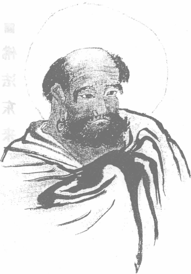
中国禅宗初祖达摩祖师(本慧法师绘)