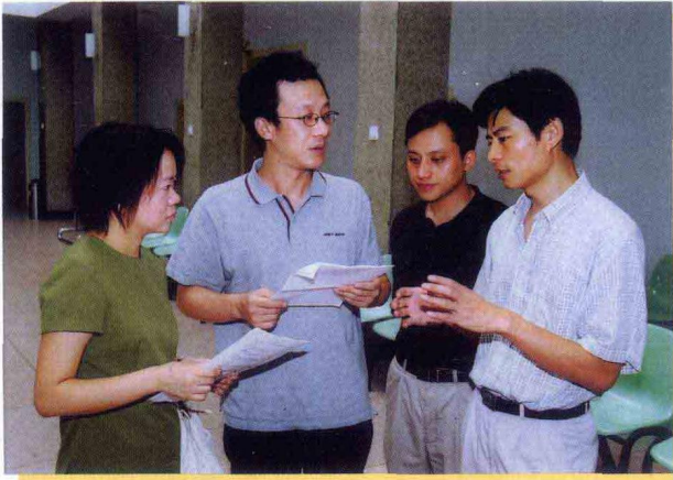
栏目组与法学专家交流节目