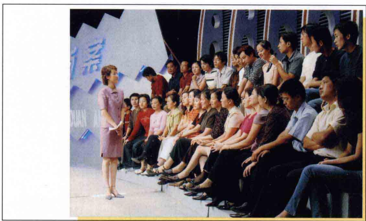
现场观众参与讨论