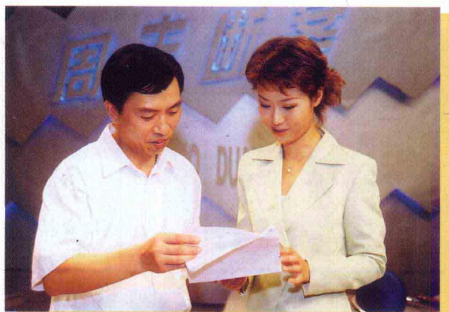
主持人与专家讨论案情