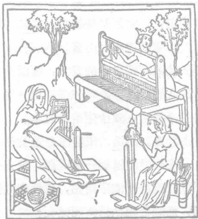
中世紀傳下的紡織

但是在 英國 工業革命的前夕，工業資本家的興趣已經不在毛紡織業方面，因爲毛紡織業受到政府的限制太嚴了。 英國 政府爲了使出口毛織物的銷路得到保證，對毛織物的出品挑剔得相當厲害。政府特派許多監視員，檢查毛織物的尺寸和重量。一