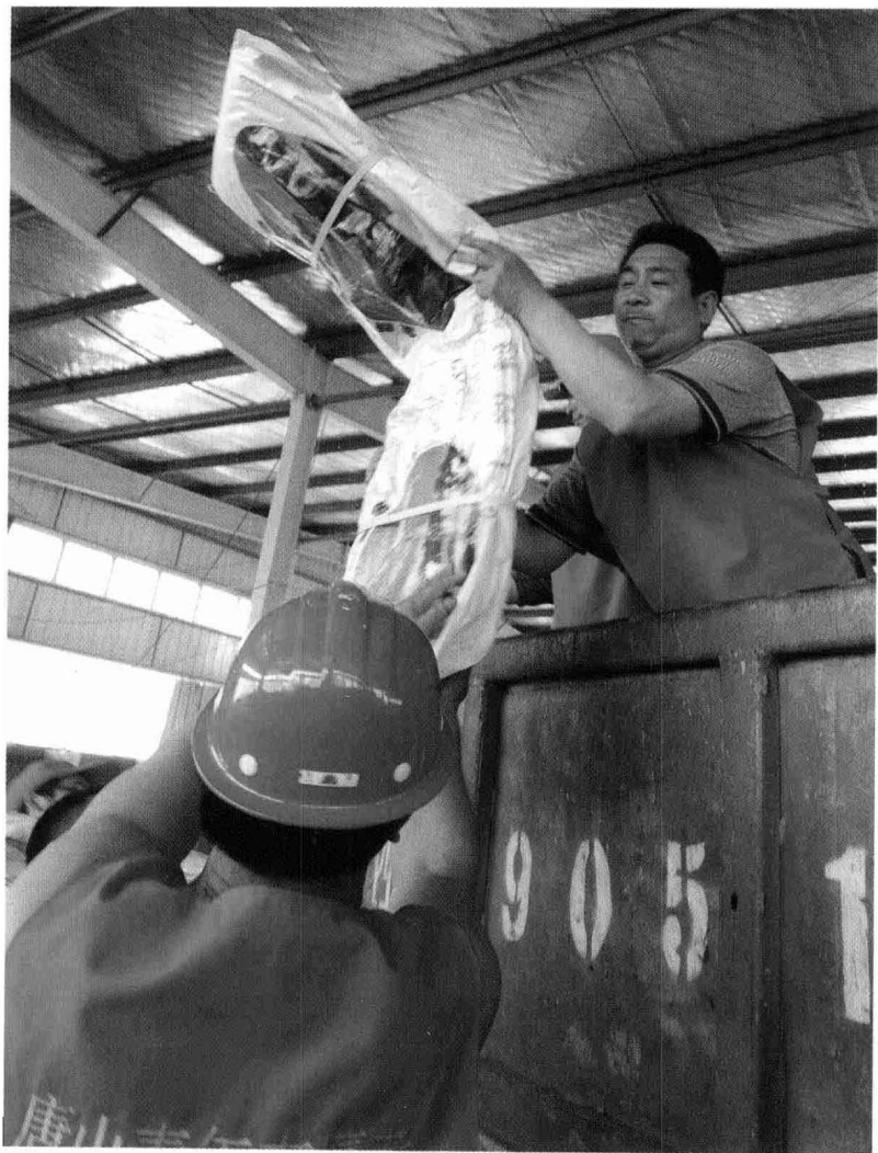
▲ 2008年5月18日，由唐山农民组成的爱心救援小分队在四川安县搬运救灾物资