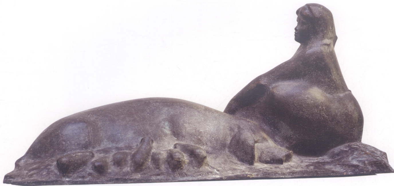
展望 (铸铜) 1984 (H)40cm / (W) 82cm 1985年获上海市美术作品展览优秀作品奖 Prospect (Bronze) Awarded The Best Prize in The Fine Arts Exhibition of Shanghai in 1985

法国雕塑家纪蒙谈雕塑艺术时用了波德莱尔的话，说艺术的规律是“精神存在的组织规律”。我将此理解为，一切用作艺术表现的有机或无机的形态，都是注入了精神和灵魂的生命形态，艺术家的义务是要透过生命生态去观照精神的存在状态。这是一个目标。雕塑家在用物质媒介表达生命形态时实际上是在复苏一个生命意识，更直白地说，是自我生命意识的唤醒，如女娲造人一般。循此目标，有“性格”的雕塑家定会将生命意识和人文精神有力地展现于世人面前。