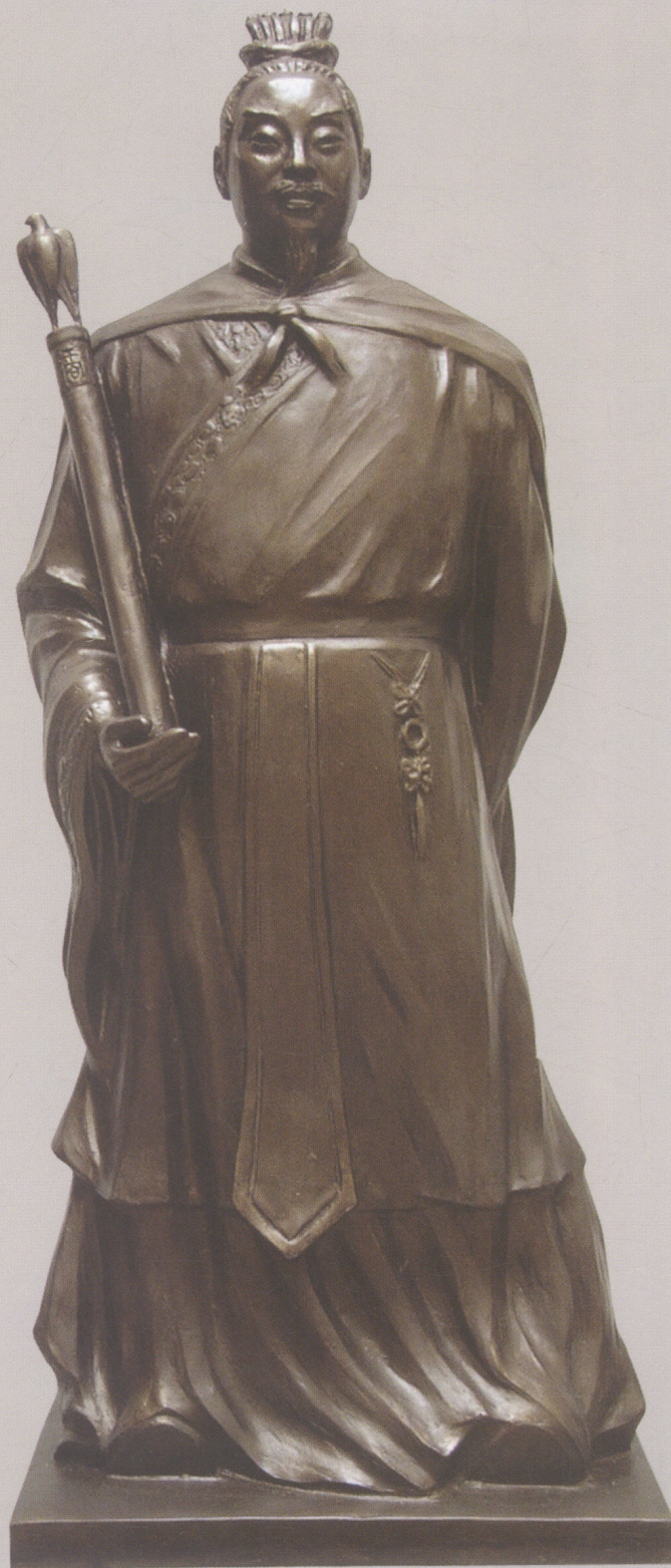
② 商祖——王亥 (铸铜) 2007 (H)90cm Business Ancestor—Wang Hai (Bronze)