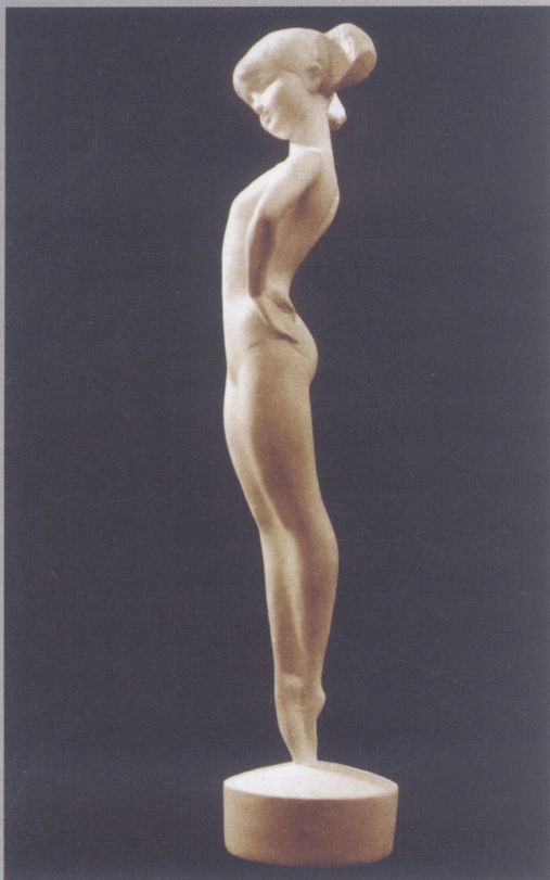
苗 (石膏) (H) 50cm Young