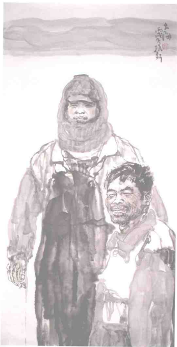
大海 132 x 68cm