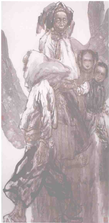
晚风 132 × 68cm