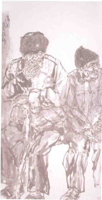
清闲 132 x 68cm