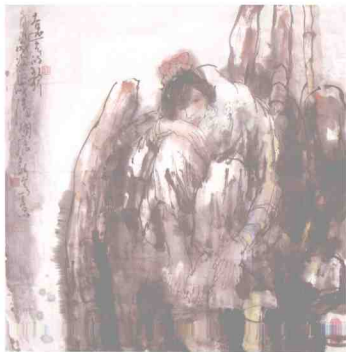
远去的身影 68 × 68cm