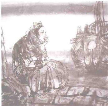
守望 68 × 68cm

虽则题材的坚守无可非议，但我还想拓展，由惠安女延伸到海边的人——海蛎——大海，我试图以大海为大背景，用写意和象征相结合的手法，表现对大自然、对人生的理解和认识。我迷恋大海和海边的一切，一条渔船，一片滩涂，一缕炊烟，都使我油然生爱，深情眷顾。行走在沙滩上，我更多的是用心灵去思考。我追求的或许不再是诗情画意，而是无法排解的人生况味。我深切地关注人的命运，把目光聚焦在海边人的生存状态和心灵反映。看似普通的生活生产活动，却能折射出人生的光辉。