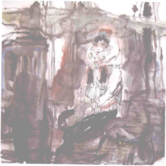
画家 66 × 66cm