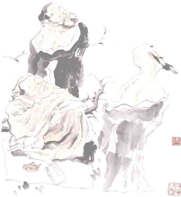
大雁图 51 x 42cm