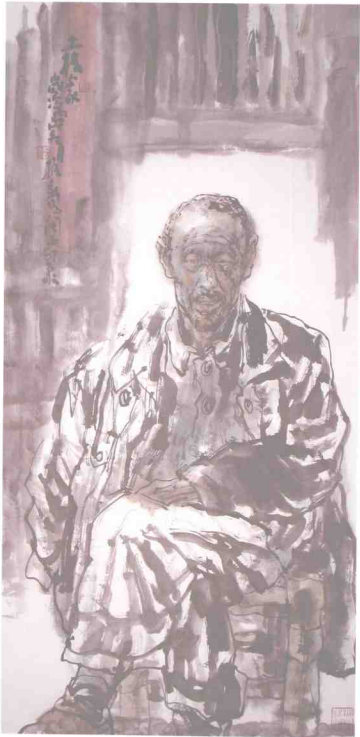
士農之像 132 x 68cm