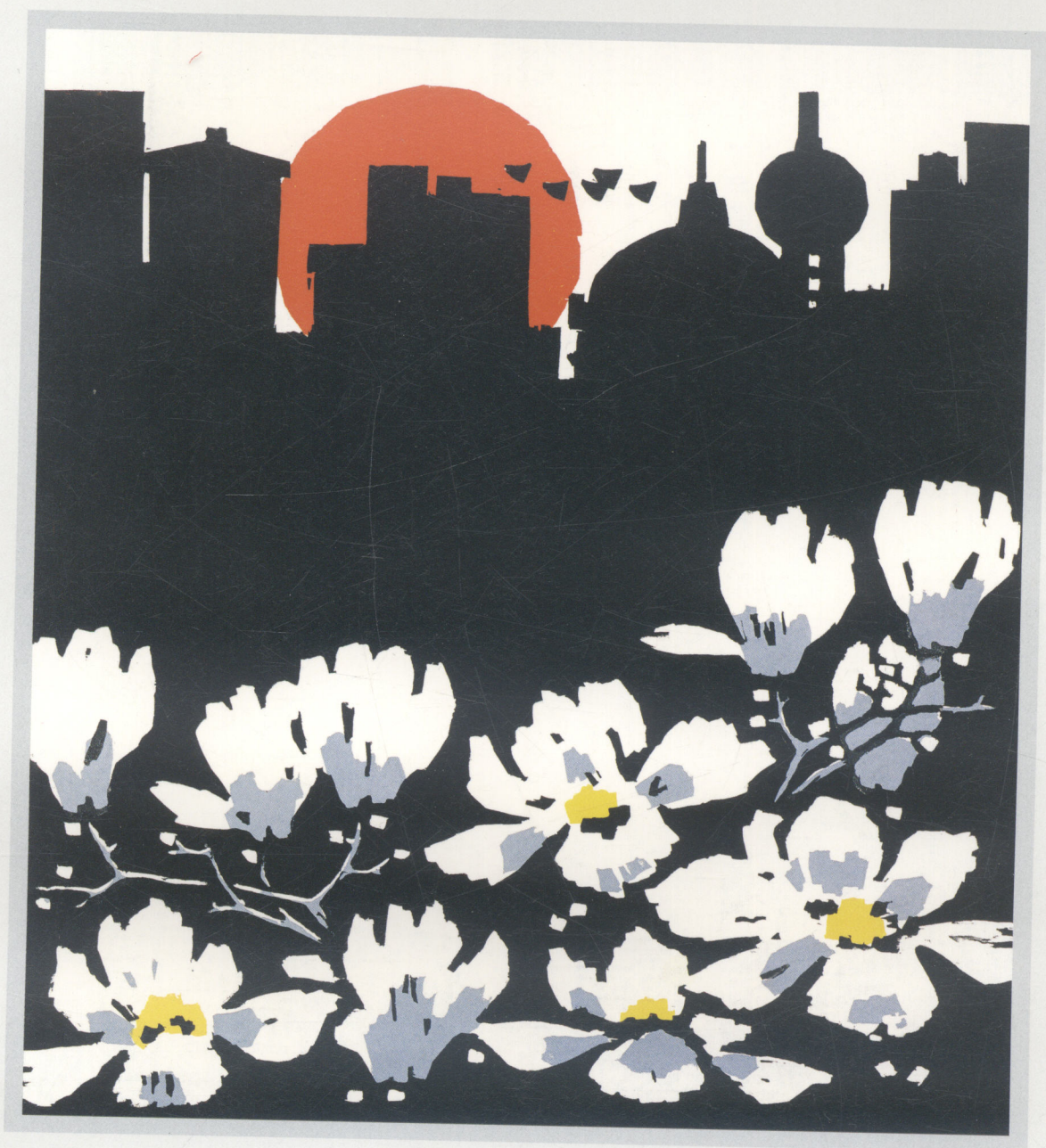
上海 您好！ Hello Shanghai!