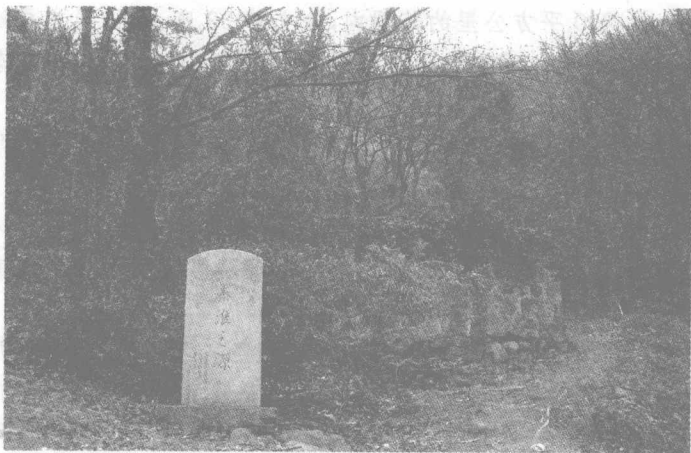
南源的东庐山距溧水县城东 10 公里

云山雾岭出清泉,我把清泉说文渊。 北宝流来十代雨,东庐溯去六朝烟。 仙姿淮水扬秀袂,异彩金陵谱新篇。 凡事有因才有果,问君焉可不思源?