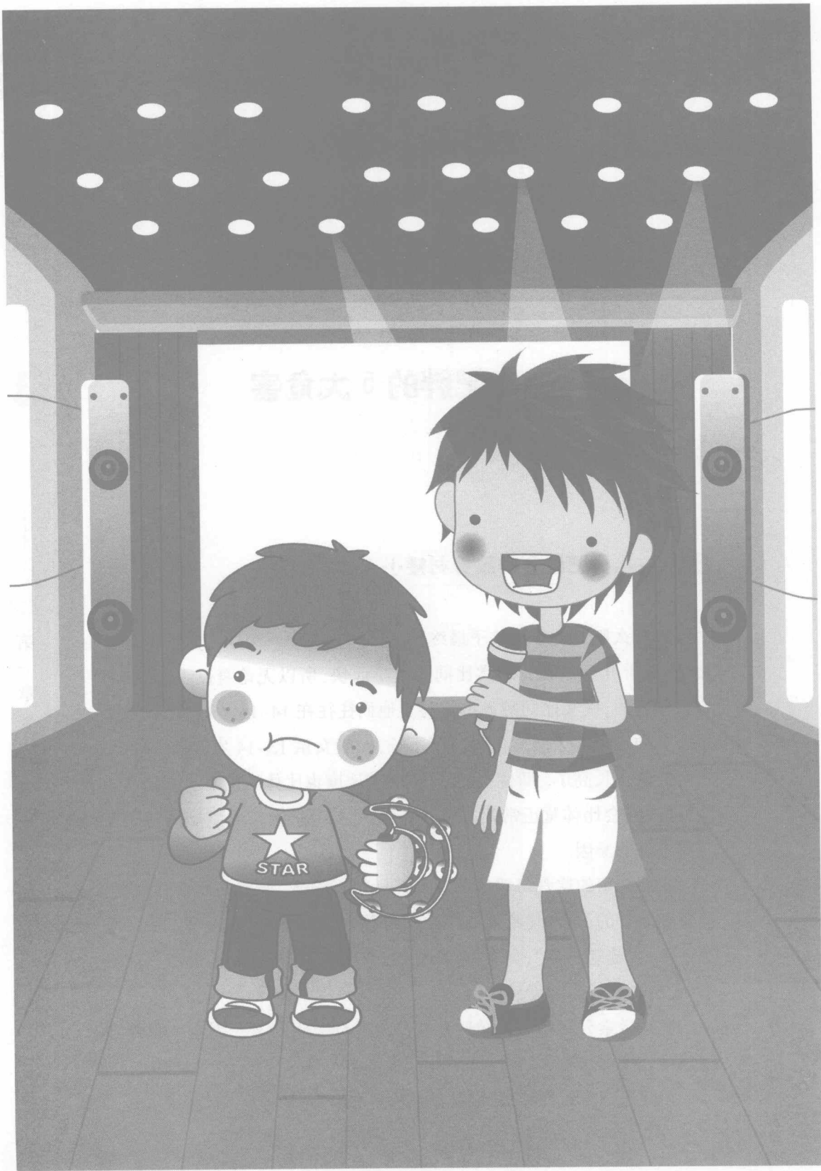
儿童肥胖易导致身材矮小