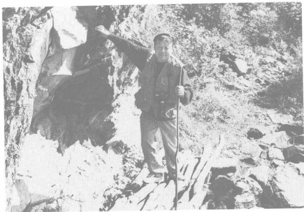
作者在秦岭深处寻访栈阁遗迹

在一起，其实，栈道、栈阁、阁道是一回事，也可以说是蜀道中的精彩华章。蜀道从长安出发，在八百里秦川可以修筑宽阔驿道，栈道是为穿越秦巴大山修筑的一种特殊道路，曾在历史上发挥过巨大的作用。有多条栈道在汉中治境内经过，因为汉中恰在西安