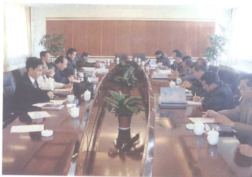
中国彝族谱牒选编·大理卷 审稿会议景