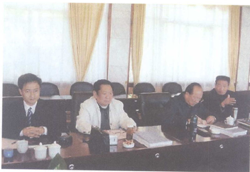
中国彝族谱牒选编·大理卷 审稿会一角