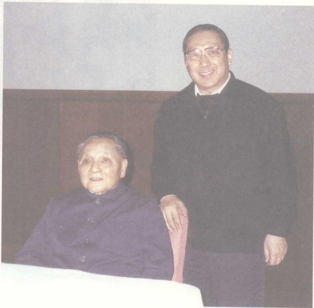
邓小平与作者在一起

1992年，我到中央工作后，有机会直接见到邓小平同志。最令我难忘的是，有一次邓小平同志对我说：“必须改革开放。不改革开放，死路一条！”这个话，他过去也多次说过。这次又当面对我讲，我把它看作是对我们这一代人的政治嘱咐，也是我毕生的座右铭和思想行动的指南。