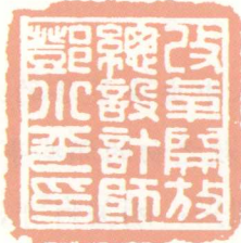
改革开放总设计师 邓小平印 (作者篆刻)

答：2003年春，我离开工作岗位退休以后，有时间来学习自幼就爱好的文化艺术知识，从事这方面的实践活动。在学习篆刻时，有一种强烈的冲动，促使我为邓小平同志篆刻了两方印：一方是“改革开放总设计师邓小平印”，另一方是“科教后勤部部长邓小平之印”。邓小平同志担任过的和国家的多项重要领导职务，都是中央“授印”任命的，唯有这两个重要“职务”，并非中央“授印”正式任命。前者是由于他在我国历史上特别是在改革开放伟大事业中所做的巨大贡献，全党和全国人民对他表达崇敬和爱戴的尊称；后者是他在“文革”后，拨乱反正，尊师重教，为科教事业排忧解难而自己任命