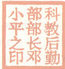
科教后勤部部长 邓小平之印 (作者篆刻)