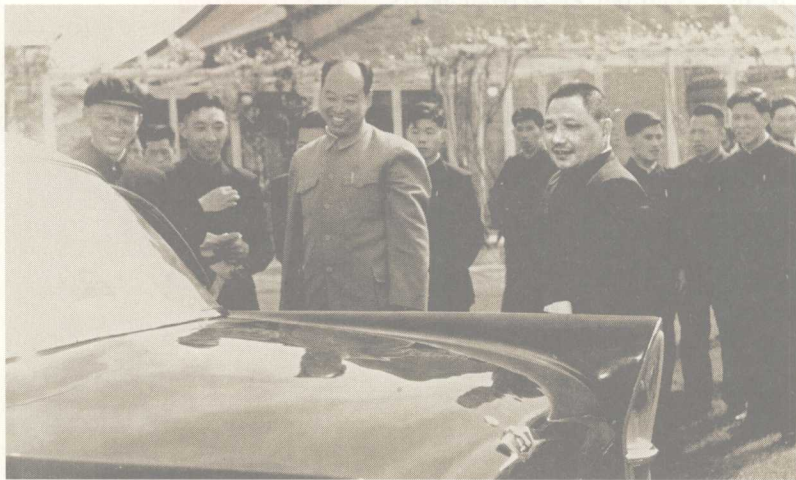
1958年，邓小平（前排右一）、彭真（前排右二）等中央领导在中南海参观第一汽车制造厂制造的东风牌轿车，作者（前排左二）介绍有关情况。

1958年，我国第一汽车制造厂生产出了第一辆国产东风牌小轿车。我有幸随厂长饶斌同志，将这辆轿车送到中南海，请中央领导同志参观。当时中南海的怀仁堂正在召开党的八大二次会议。饶斌同志是八大代表，他在里面开会，我和轿车总设计师史汝辑等几位同志，在怀仁堂后面的草坪上等候中央领导和会议代表在会议休息时前来参观。整个会议期间我们基本上都在那里，几乎见到所有中央领导同志，中办机要室主任叶子龙同志还安排我们旁听了毛泽东主席讲话。