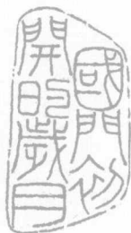
国门初开的岁月 (作者篆刻)