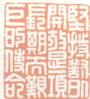
坚持对外开放是一项 长期而艰巨的使命 (作者篆刻)

答：对外开放是一项长期的基本国策，今后要走的路还很长，有些问题尚未完全解决，不可避免地还会出现这样那样新的问题，需要一代又一代人的不懈努力。20世纪60年代以后出生的当代青年，他们有的当时年龄还小，有的没有亲历过那个年代。我想把我们这一代人经历过的一些事情告诉他们，帮助他们了解邓小平同志提出对外开放战略部署的背景，提出的过程，遇到的问题，解决的方法，使他们珍惜来之不易的成果，以便他们更好地继承、发展邓小平同志为我们开创的伟大事业。