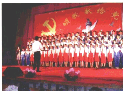
大连市长海县高级中学师生合唱