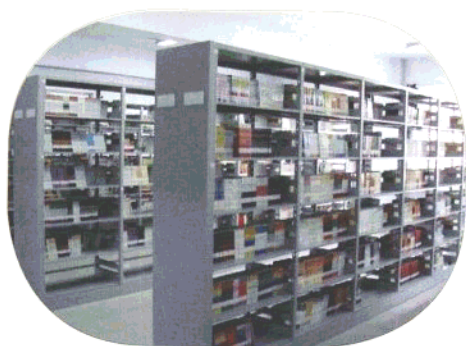
凌海市第一高级中学图书馆