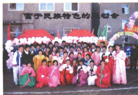
抚顺市朝鲜族第一中学运动会