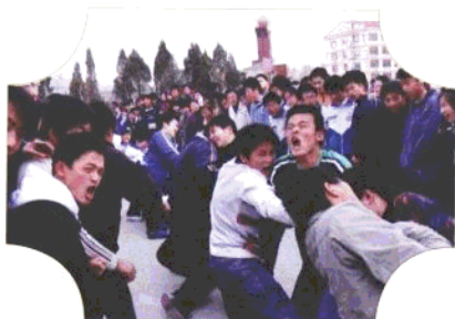
建平县实验中学的学生们在拔河