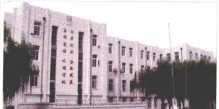
抚顺市朝鲜族第一中学