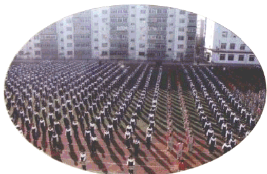
沈阳市第五十一中学的体育活动