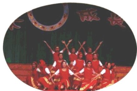
北票市高级中学学生们的文艺演出