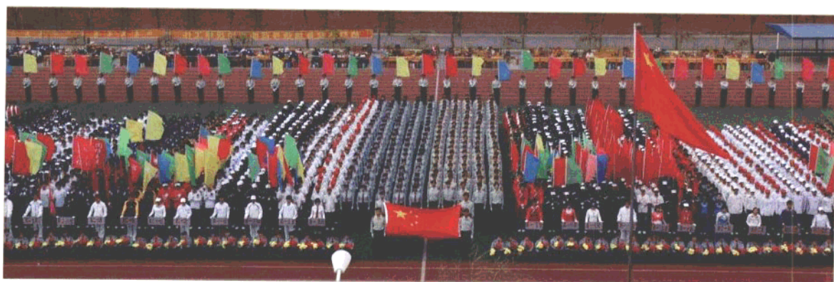
阜蒙县蒙古族实验中学的学生们在开运动会