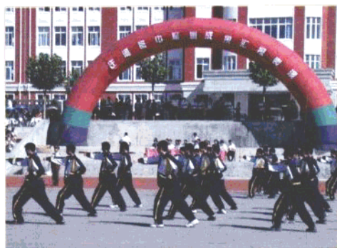
庄河高中学生军训