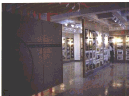
大连市第十五中学展厅