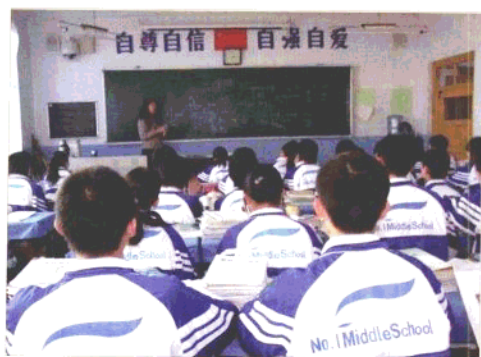
宽甸满族自治县第一中学的师生们在上課