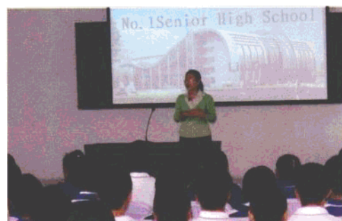
东港市第一中学英语老师在上市级公开课