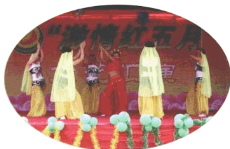
辽中县第一高级中学的学生们在文艺演出