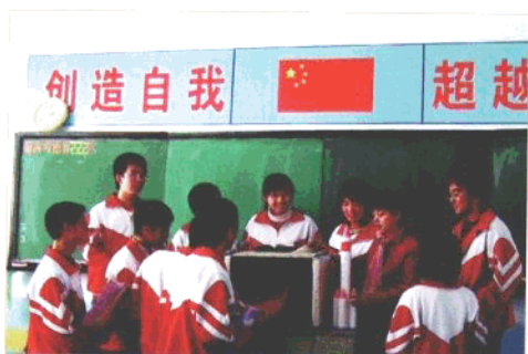
开原市高级中学的学生们在开展研究学习活动