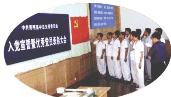
大连市育明高中入党宣誓暨优秀党员表彰大会