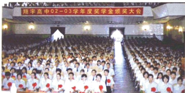
沈阳市翔宇中学年度奖学金颁奖大会