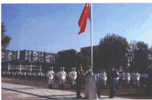
鞍山市田家炳高级中学升旗仪式