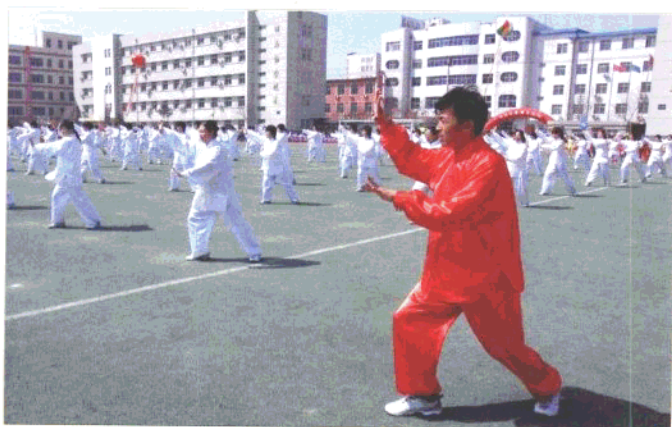
辽河油田第二高级中学的师生太极拳