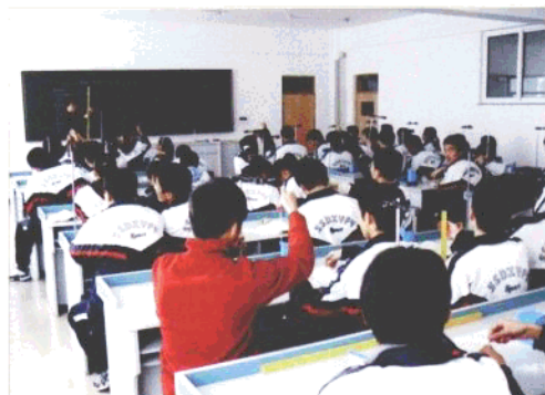
岫岩县高级中学实验室活动