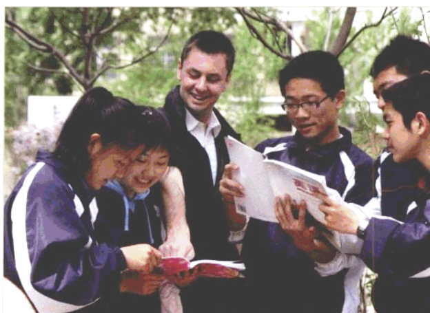
沈阳市同泽高级中学的学生们在与外教交流