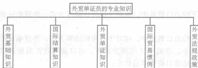
图 0-3 外贸单证员的专业知识要求