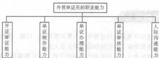
图 0-2 外贸单证员的职业能力要求

外贸单证员应具备开证审证能力、单证制作能力、单证办理能力、单证审核能力、人际沟通能力等职业能力，见图 0-2。