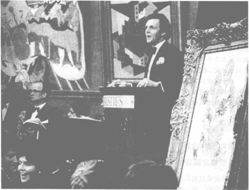
伦敦佳士得拍卖会

拍卖行会根据其行业的特点,适时组织拍卖活动,如相关商品拍卖等,在拍卖过程中,发挥市场中介组织的重要作用,维护拍卖活动各方当事人的合法权益。